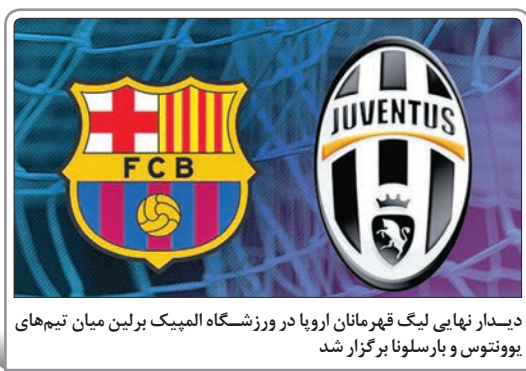
دیدار نهایی لیگ قهرمانان اروپا در ورزشگاه المپیک برلین میان تیم‌های یوونتوس و بارسلونا برگزار شد

در ست دوم لهستانی‌ها ۲۵ بر ۲۲ برای ما رسیدند. در ست سوم ملی‌پوشان کشورمان بازی را بهتر آغاز کردند و کواج از دو چهره جدید یعنی صنوبر و معنوی‌نژاد استفاده کرد. عملکرد بازیکنان کشورمان در این ست آنقدر خوب بود که حریف به هم ریخته بازی می‌کرد و سرویس‌ها و اسپیک‌های زیادی را از دست داد تا در نهایت ۲۵ بر ۲۱ ایران برنده شود. در ست چهارم لهستانی‌ها ۲۷ بر ۲۵ به پیروزی رسیدند و سه بر یک برنده بازی شدند تا سه امتیاز کسب کنند و ایران از کسب امتیاز ناگم ماند.