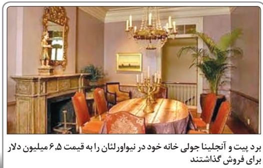
برد بیت و آنجلینا جولی خانه خود در نیواورلئان را به قیمت ۶.۵ میلیون دلار برای فروش گذاشتند

بگیریم، او در پایان گفت: به‌عنوان شهروندان جامعه حق طبیعی خود می‌دانیم که در مکان‌های عمومی اجازه فیلمبرداری داشته باشیم و انتظار داریم برخورد خودی و غیرخودی با سینماگران صورت نگیرد. «لانتوری» داستانی عاشقانه دارد و باران کوثری، نوید محمدزاده و مریم پالیزیان نقش‌های اصلی این فیلم را بازی می‌کنند. تهیه‌کنندگی و کارگردانی «لانتوری» را رضا درمیشیان بر عهده دارد.