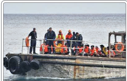
مقامات چین اعلام کردند: تاکنون اجساد ۱۳۳ نفر در رابطه با حادثه واژگونی کشتی مسافری «ستاره شرق» در رود یانگ‌تسه یافت شده است

در میان زنان کارتن‌خواب و خیابانی، برخی به همراه کودکان‌شان هستند و برخی نیز باردار هستند که این موارد لزوم توجه به زنان کارتن‌خواب را افزایش می‌دهد. دانشور با بیان اینکه سامان‌سراهای مادران کارتن‌خواب باید جدا از سایر زنان کارتن‌خواب باشد، گفت: معمولاً این زنان، کودکان زیر ۱۰ سال همراه خود دارند یا باردار هستند و استفاده از سامان‌سراهای عمومی در روحیه این کودکان تأثیرات بدی می‌گذارد و آنها را آماده آسیب‌پذیری می‌کند.