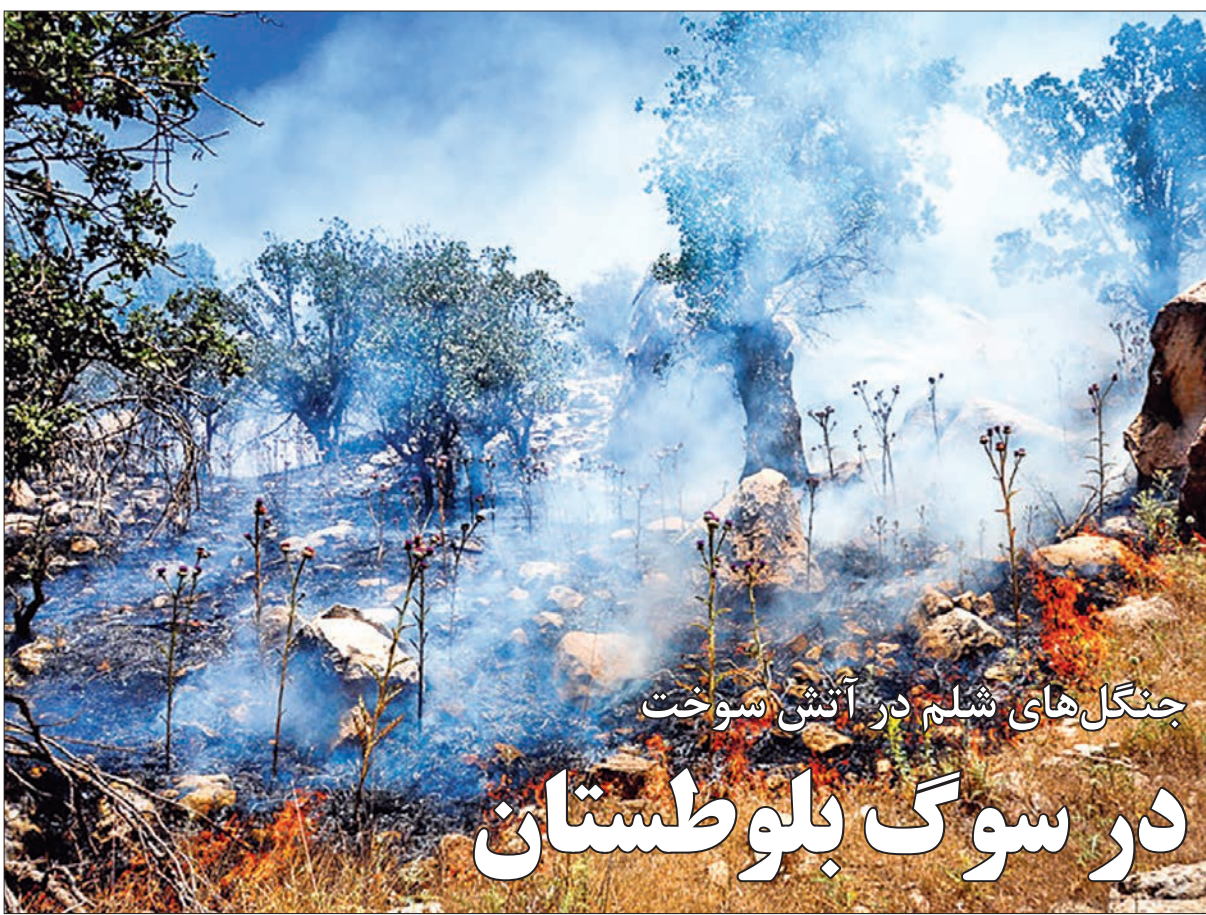
جنگل های شلم در آتش سوخت