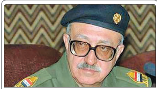
طارق عزیز، وزیر خارجه دولت صدام حسین در سن ۷۹سالگی به دلیل سکنه قلبی درگذشت

قبل از این هم مقامات عربستان سعودی اعلام کردند در حملات زمینی از گارد جمهوری حامی علی عبدالله صالح به خاک عربستان سعودی چهار نفر از نظامیان سعودی کشته شدند. عربستان سعودی در رأس ائتلافی از ۱۲ کشور، از اوایل فروردین ماه گذشته تاکنون حملات گسترده زمینی، هوایی و دریایی را علیه یمن آغاز کرده است.