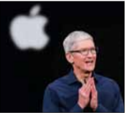
اپل برند تحسین شده سال ۲۰۲۰