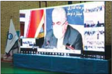
اجرای پروژه های آبرسانی هرمزگان برداشته شد وزیر نیرو، افتتاح سه پروژه آبرسانی و فاضلاب در هرمزگان که امروز مورد بهره برداری

قرار گرفت به عنوان سه گام ارزنده یاد کرد که مردم شهرستان های بشاگرد، میناب و بندرعباس از آن بهره مند شدند. به گفته اردکانیان، افتتاح پروژه آبرسانی از سد سپهران به گوهران و ۱۳ روستای مسیر، افتتاح پنج شیرین کن مهندسی آباد و افتتاح تصفیه خانه و شبکه جمع آوری فاضلاب تیاب را حاصل تلاش های انجام شده مسئولان هرمزگان دانست که در شرایط سخت به بهره برداری رسید. وی انکای هرمزگان بویژه شهر بندرعباس به منابع آب شیرین کن ها را یک اقدام ارزنده دانست و گفت: اجرایی شدن این سیاست باعث شد تا آب مورد نیاز جمعیت زیادی از هرمزگان در شرایط خشکسالی با اطمینان بالایی تولید شود. وزیر نیرو در پایان از تلاش های فریدون همتی استاندار هرمزگان و امین قصمی مدیرعامل شرکت آب و فاضلاب هرمزگان نیز بصورت ویژه تقدیر کرد