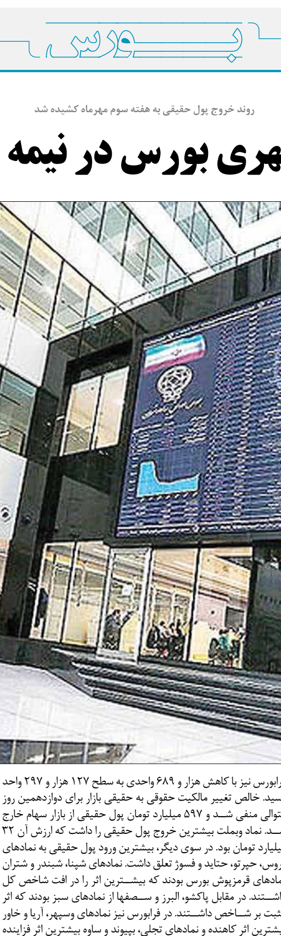
روند خروج پول حقیقی به هفته سوم مهرماه کشیده شد

در اولین روز معاملاتی از هفته سوم مهرماه، شاخص کل بورس ۱۶ هزار و ۸۶۴ واحد نسبت به روز کاری قبل کاهش یافت و در ارتفاع ۲ میلیون و ۵۲ هزار واحد ایستاد. شاخص کل هم‌وزن نیز با ۶ هزار و ۷۱۰ واحد کاهش در رقم ۷۰۹ هزار و ۲۶۸ واحد ایستاد. شاخص کل فرابورس هم با ریزش ۲۴۳ واحدی به رقم ۲۵ هزار و ۶۸۴ واحد رسید. شاخص هم‌وزن