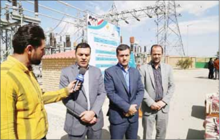
دستگاه ترانسفورماتور ۳۰ مگاوات آمپری با موفقیت به داودآبادی در ادامه بازدید، با افزایش ظرفیت پست مذکور ضمن بالابردن قابلیت اطمینان ،پاسخگویی به نیاز پایان رسید.

وی اظهارداشت: پست مذکورفیلترین آب با ظرفیت ۳۰ مگاوات آمرفعال بود که به منظور جلوگیری از کمبود بار انرژی الکتریکی در این بخش از استان لرستان، ظرفیت پست فوق توزیع موسوم به الیگودرز ۳ به ۶۰ مگاوات آمپر در دستور کار قرار گرفت و با نصب یک