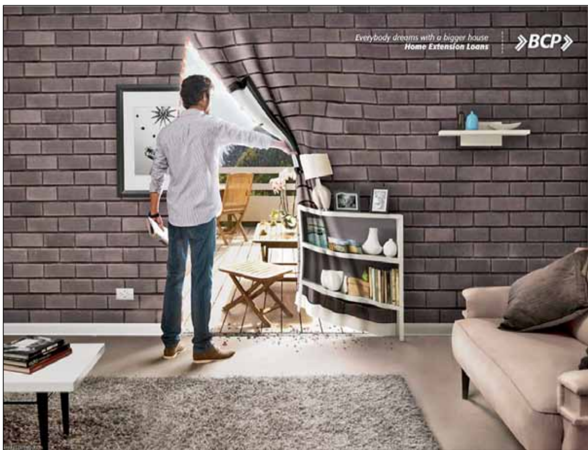
آگهی: بانک BCP - شعار: همه آدم‌ها آرزو می‌کنند که خانه بزرگ تری داشته باشند!