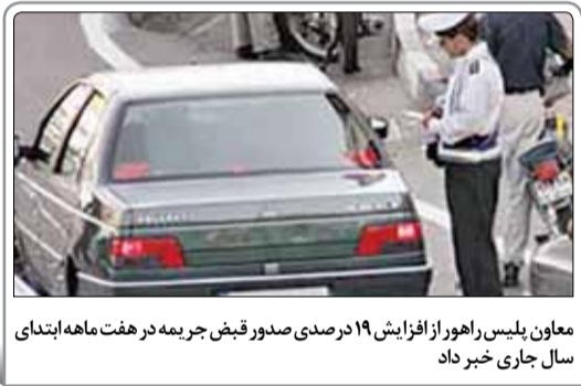
معاون پلیس راهور از افزایش ۱۹ درصدی صدور قبض جریمه در هفت ماهه ابتدای سال جاری خبر داد