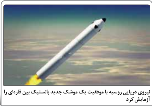
نیروی دریایی روسیه با موفقیت یک موشک جدید باستیک بین قاره‌ای را آزمایش کرد