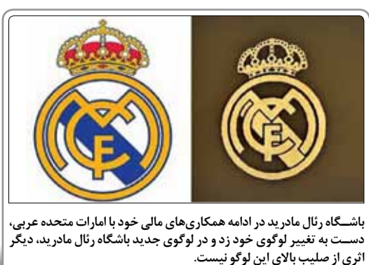
باشگاه رئال مادرید در ادامه همکاری‌های مالی خود با امارات متحده عربی، دست به تغییر لوگوی خود زد و در لوگوی جدید باشگاه رئال مادرید، دیگر اثری از صلیب بالای این لوگو نیست.