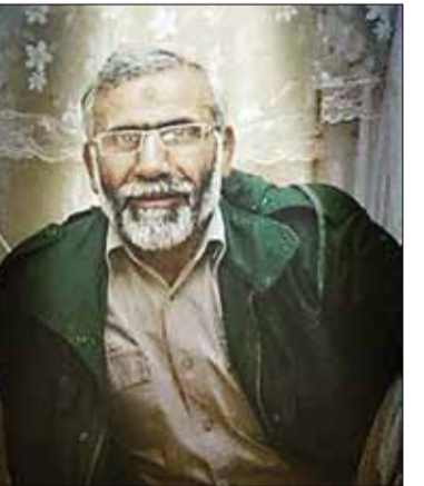
داعش در شهر سامرا و در جوار مرقد مطهر امام عسگری (ع) به شهادت رسید. این اطلاعیه افزوده است: شهید تقوی از فرماندهان قرارگاه رمضان در دروان دفاع مقدس بود که عظیم شهادت نائل آمدند.

سپاه پاسداران انقلاب اسلامی با تبریک و تسلیت شهادت سرتیپ پاسدار محمد تقوی به محضر حضرت ولی‌عصر (عج)، مقام معظم رهبری (مدظله‌العالی)، ملت انقلابی ایران اسلامی به‌ویژه مردم شهید پرور خوزستان و خانواده و بستگان این شهید والامقام اعلام کرد: مراسم تشییع پیکر مطهر شهید تقوی در تهران دوشنبه (۸ دی ماه) ساعت ۹ صبح در حسینیه عاشقان ثارالله ستاد فرماندهی کل سپاه برگزار خواهد شد. گفتنی است، پیکر مطهر این سردار رشید اسلام روز سه شنبه (۹ دی ماه) در اهواز تشییع و به خاک سپرده خواهد شد.