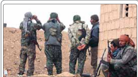
دیدبان حقوق بشر سوریه اعلام کرد: یگان‌های حمایت از کردهای سوریه ظرف چند روز اخیر موفق شدند بخش‌های گسترده‌ای از کوبانی در نوار مرزی سوریه را به کنترل خود در آورند

رهبان کرد عراق پاسپورت انگلیسی و ملیت این کشور را اعطا کرد. فواد معصوم پس از انتخاب شدن به‌عنوان رییس جمهوری عراق به مقامات لندن اطلاع داد که براساس قانون اساسی کشورش ملیت و پاسپورت انگلیسی خود را پس خواهد داد. قانون اساسی عراق تصریح کرده است که مسئولان این کشور حق داشتن ملیتی غیر از ملیت عراق یا پاسپورتنی غیر از پاسپورت کشورشان را ندارند.