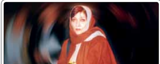
مسعود کیمیایی فیلم جدیدش را با عنوان موقت «تنفس» اردیبهشت‌ماه سال آینده کلید می‌زند و امیدوار است که یکی از نقش‌های آن را فریماه فرجامی بازی کند

خشونت‌باری که در آن است، قابل اکران عمومی نیست، بنابراین به همین دلیل هم، ما اعلام می‌کنیم که نمی‌توانیم این فیلم را اکران عمومی کنیم. وزیر فرهنگ و ارشاد اسلامی افزود: البته این فیلم در حد محدودی و به‌صورت اکران خصوصی مثلاً در موزه سینما، ممکن است بتواند اکران شود آن هم با شرایط ویژه‌ای که کسانی که کمتر از ۱۶ سال سن دارند، نتوانند فیلم را ببینند و بزرگسالان بتوانند آن را تماشا کنند. البته این بخش هم قابل اصلاح نیست، چون اگر بخش اول فیلم را که در آن پدری، دختر خودش را با وضع فجیعی زنده به گور می‌کند، از فیلم حذف کنیم، کل داستان از بین می‌رود و قابل اصلاح نیست.