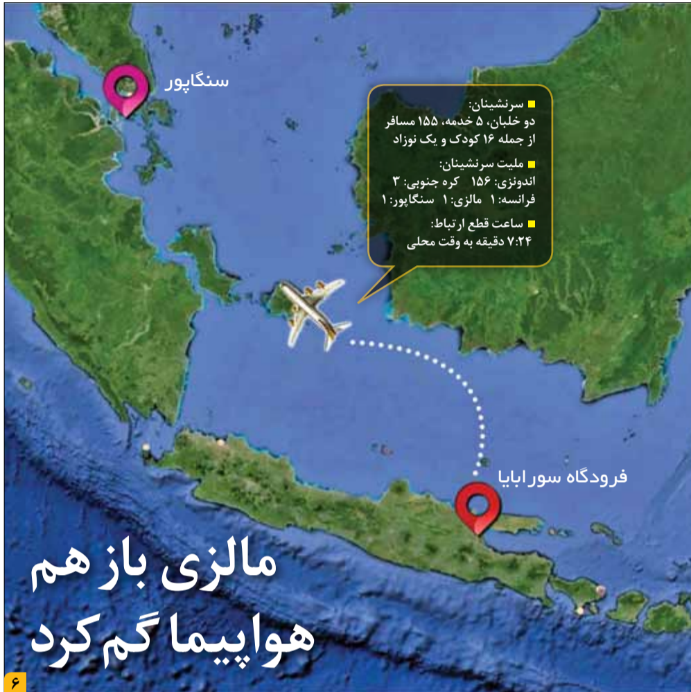
مردک غنیانی / فرصت امروز