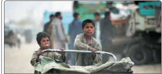
رسانه‌های پاکستان اعلام کردند که دولت این کشور قصد دارد مدت اقامت مهاجران افغان را بیش از ۳۱ دسامبر سال ۲۰۱۵ میلادی تمدید نکند

پلیس آمریکا از تصادف زنجیره‌ای دست‌کم ۱۲۳ خودرو در یکی از بزرگراه‌های میشیگان و کشته شدن یک تن خبر داد. رییس ستاد محیط زیست و توسعه پایدار شهرداری تهران گفت: تامین انرژی مورد نیاز اماکن عمومی شهر تهران از انرژی‌های پاک و تجدیدپذیر از مهم‌ترین برنامه‌های شهرداری تهران است. متخصصان تغذیه و سلامت می‌گویند مصرف آووکادو می‌تواند در کاهش کلسترول بد خون مفید باشد.