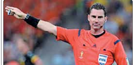
بنجامین ویلیامز داور سرشناس استرالیایی بازی ایران و بحرین را قضاوت می‌کند

فدراسیون جهانی وزنه‌برداری (IWF) در یک نظرسنجی بهترین وزنه‌بردار جهان را در سال ۲۰۱۴ معرفی خواهد کرد. رییس فدراسیون فوتبال با اشاره به ملاقات خود با بازیکنان تیم ملی گفت: روحیه بازیکنان برای بازی مقابل بحرین بالا است. آنجلوئی سرمربی رئال مادرید در یک مصاحبه گفت که خودش را از مورینیو بهتر می‌داند.