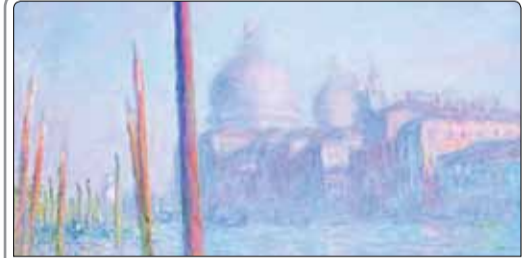
«ساتی» تابلویی از «کلود مونه» نقاش بزرگ فرانسوی را به قیمت تخمینی ۳۰ میلیون پوند برای فروش می‌گذارد

معاون حقوقی و پارلمانی وزیر فرهنگ و ارشاد اسلامی تصریح کرد: آنچه به وزارت ارشاد مربوط می‌شود، بررسی صلاحیت‌های فنی و تخصصی افراد است و در این حوزه، استاد شجریان از نظر ما مسئله‌ای ندارد و مورد تایید وزارت ارشاد است. یوپی، رییس سازمان سینمایی به سینماگرانی که آثارشان در جشنواره فجر پذیرفته نشده است، قول داد فرصت دیده‌شدن آثارشان در شرایط ایده‌آل فراهم شود.