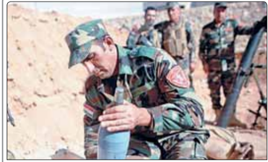
نیروهای پیشمرگ کرد، حمله داعش به منطقه کویر در جنوب شهر اربیل را ناکام گذاشتند و خسارات سنگینی را به داعش وارد کردند

سیدحسین خمینی در مراسم اختتامیه همایش معاونان و مدیران فرهنگی واحدهای دانشگاه آزاد گفت: امام وقتنی با شاه و سپس با آمریکا و صدام جنگید نگفت می‌خواهم فدا شوم، اما در مقابل تجریر این سخن را گفت، لذا باید به تجریر به‌عنوان یک نقطه حساس و خط قرمز توجه کرد سال گذشته «نئیس رادمین» بسکتبالیست آمریکایی در کره شمالی برای رهبر جوان پیونگ یانگ آهنگ «تولدت مبارک» را خواند اما امسال جشن تولدی برای کیم جونگ اون برگزار نشد.