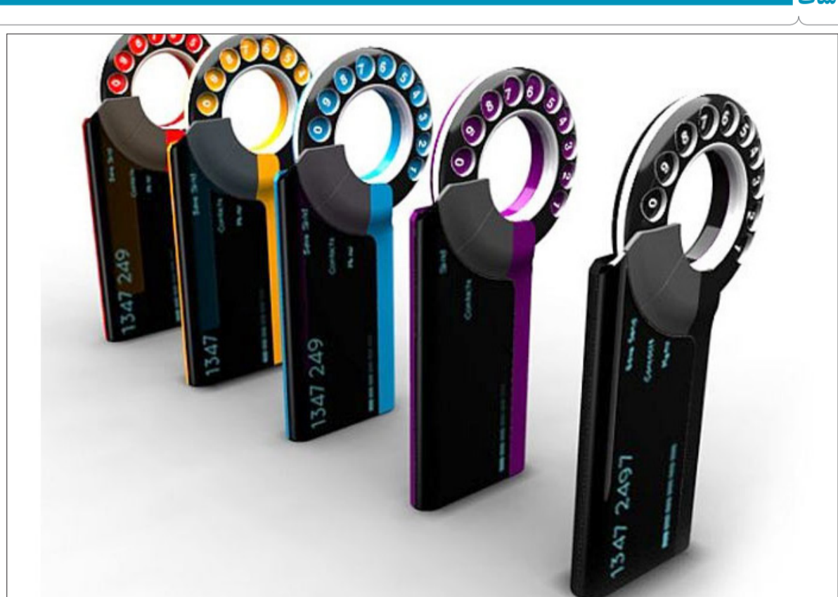
شرکت سامسونگ مدلی از تلفن را ارائه داده که با نام go back in time مشهور شده...