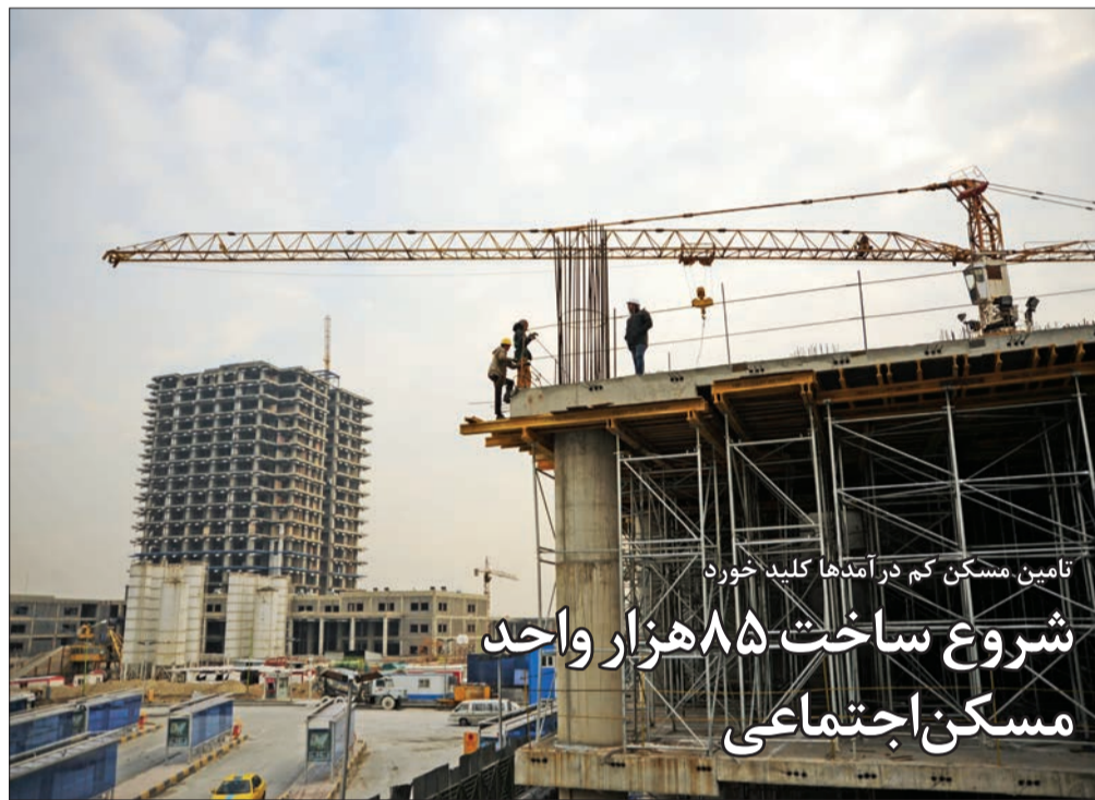
تأمین مسکن کم درآمدها کلید خورد شروع ساخت ۸۵ هزار واحد مسکن اجتماعی