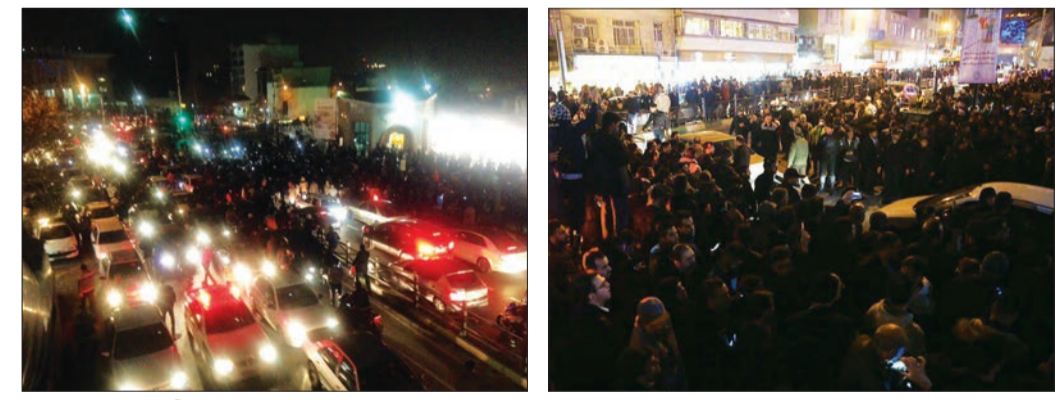
حضور گسترده مردم در خیابان‌های اطراف بیمارستان شهدای تجریش پس از شنیدن خبر فوت آیت‌الله هاشمی رفسنجانی

«بدخواهان باید بدانند هاشمی زنده است چون نهضت زنده است.» این جمله‌ای تاریخی است که مرحوم امام خمینی (ره) پس از جان سالم به در بردن آیت‌الله هاشمی رفسنجانی از ترور گروه فرقان در پیام خود نوشت. همگان بی‌تردید و به‌رغم هر اختلاف نظری متفق‌القول هستند که نام او با کلیت انقلاب و جمهوری اسلامی گره خورده است. بسیاری از سیاست‌مداران هاشمی رفسنجانی را بزرگترین سیاست‌مدار قرن سوم می‌دانند. هاشمی رفسنجانی علاوه بر ایفای نقش بی‌بدیل در سازماندهی مبارزات انقلابی که منجر به پیروزی انقلاب اسلامی ۵۷ شد، فرماندهی جنگ علیه دشمن یعنی را بر عهده داشت و در سال‌های پس از انقلاب سمت‌های مهمی از عضویت مجلس خبرگان قانون اساسی، ریاست مجلس خبرگان رهبری و ریاست مجلس شورای اسلامی تا ریاست جمهوری را بر عهده گرفت. بجز سمت ریاست مجمع تشخیص مصلحت، هاشمی تقریباً تمامی سمت‌های سیاسی و اجرایی خود را با رای مردم به دست آورد. مرحوم هاشمی علاوه بر کارهای اجرایی همواره به عنوان یکی از تئوریسین‌های انقلاب و حکومت اسلامی شناخته می‌شد و رابطه نزدیک و منحصرنفرد او با امام خمینی (ره) و رهبر انقلاب از او فردی مؤثر در کلیه اتفاقات پس از انقلاب ساخته بود.