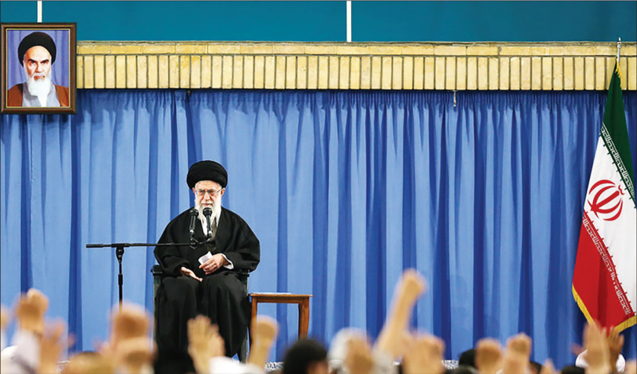
رهبر انقلاب در دیدار مردم قم: