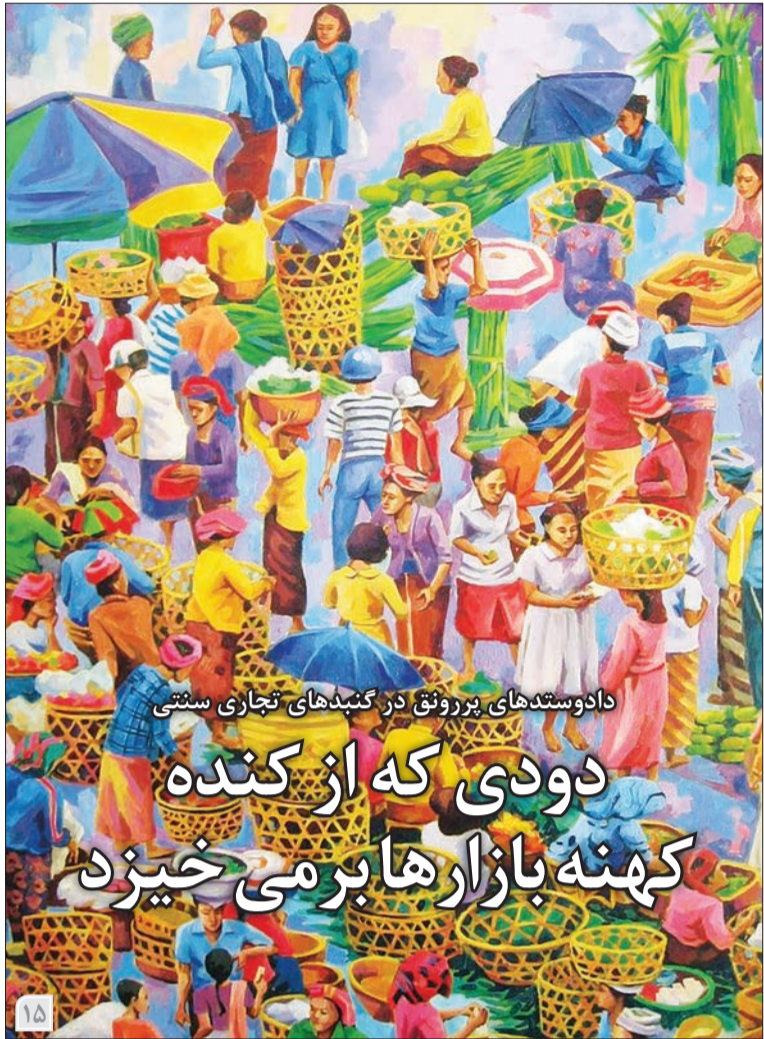
دادوستدهای پرونق در گنبدهای تجاری سنتی