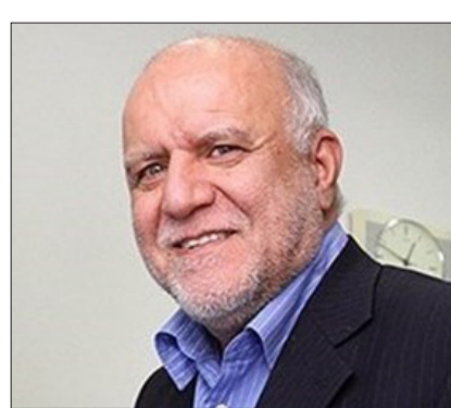
تولید از میدان‌های مشترک

وزیر نفت از برگزاری بزرگ‌ترین مراسم افتتاح طرح‌های نفتی به ارزش ۲۰ میلیارد دلار با حضور رئیس‌جمهوری در هفته آینده خبر داد و گفت: پارسال متوسط صادرات نفت و میعانات گازی ما به بیش از ۲ میلیون و ۶۰۰ هزار بشکه در روز رسید که امسال نیز همان روند را ادامه می‌دهیم. بیژن زنگنه در حاشیه نشست هیأت دولت درباره افتتاح طرح‌های جدید در سلسله بیان داشت: فازهای جدید پارس جنوبی و لایه نفتی این میدان که برای نخستین بار از آنها تولید صورت می‌گیرد به همراه چند طرح بزرگ پتروشیمی، یکشنبه هفته آینده با حضور رئیس‌جمهوری افتتاح می‌شود.