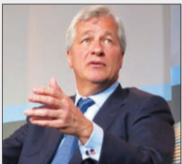
مدیرعامل JP Morgan: بیت کوین کلاهبرداری است