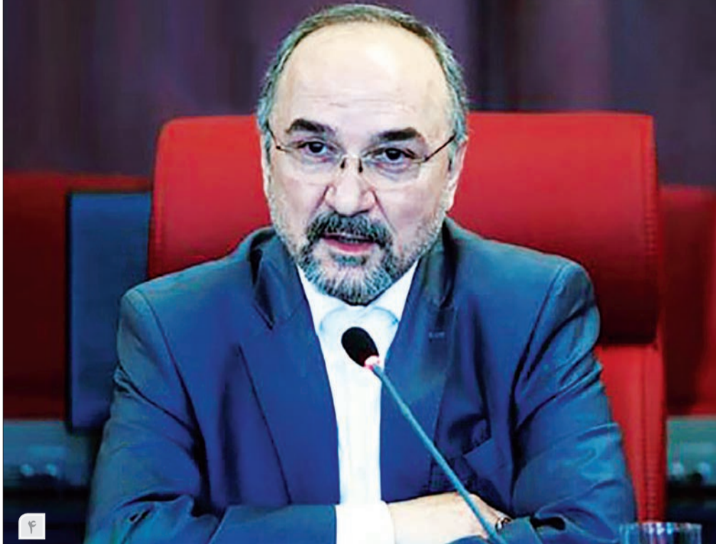
ظهور نوفنودالیسم به جای اقتصاد دانش‌بنیان