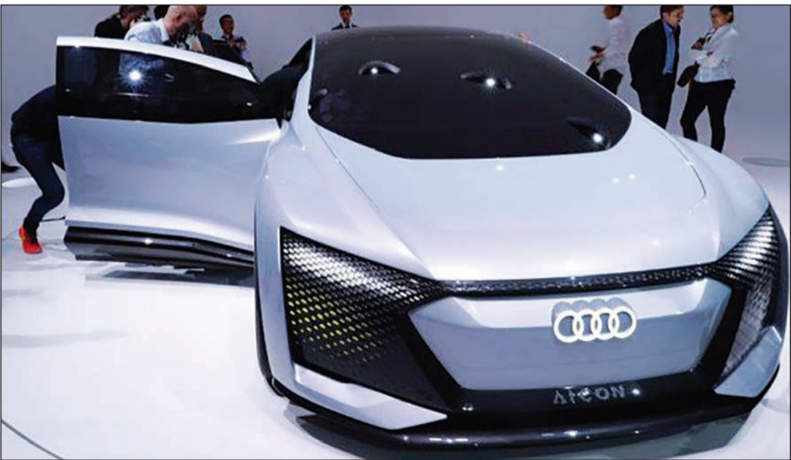
طرح اولیه آئودی از خودروی خودران برقی رونمایی شد.