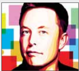
کارخانه شکلات سازی ایلان ماسک راه اندازی می شود