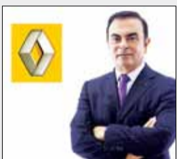
ادامه فعالیت رنو در ایران رسماً تایید شد