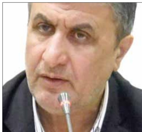
روحانی ۴ وزیر پیشنهادی خود را به مجلس معرفی کرد