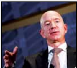
چرا جف بزوس در مورد جمال خاشقچی اظهار نظر نمی‌کند