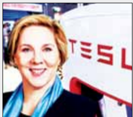
یک خانم جانشین ایلان ماسک در هیات مدیره تسلا شد