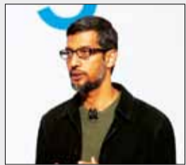
گوگل روی استار تاپ ژاپنی ABEJA سرمایه‌گذاری می‌کند