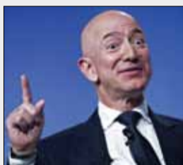
اخراج کارمندان آمازون توسط هوش مصنوعی