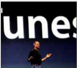
اپل پس از ۱۸ سال آیتونز را بازنشسته می‌کند