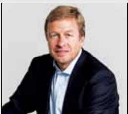
الیورزیسه مدیرعامل بی ام و شد