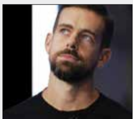
حساب کاربری جک دورسی مدیرعامل توییتور هک شد