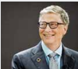
ثروتمندترین افراد در کشورهای مختلف