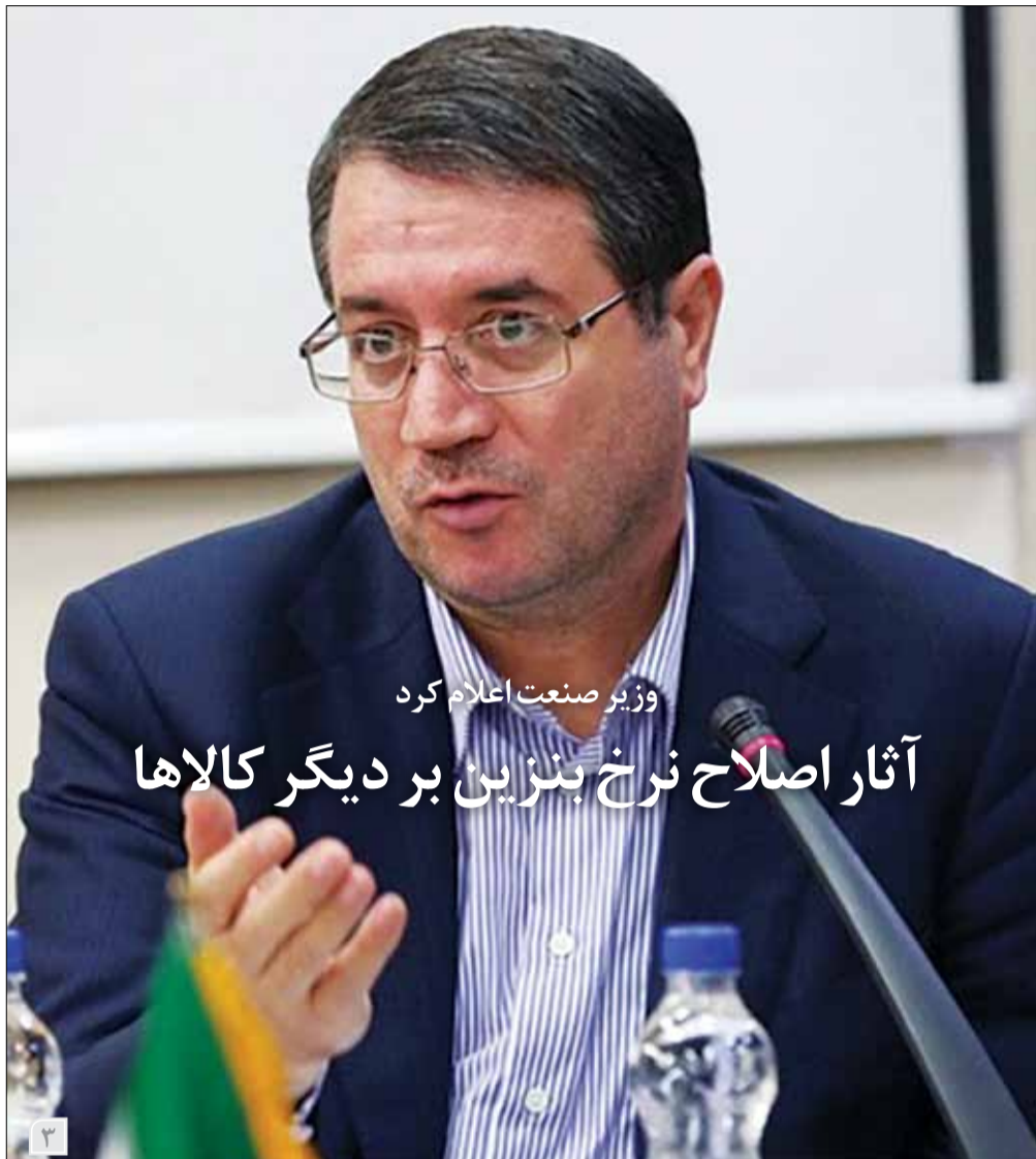
وزیر صنعت اعلام کرد