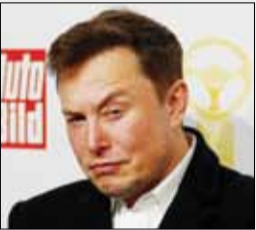
سایبر تراک سوار بر استار شپ؛ ایده احتمالی جدید ایلان ماسک

آذری جهرمی از راه‌اندازی نخستین پهپاد پستی دفاع کرد