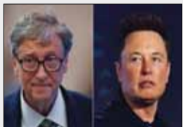
دلخوری ایلان ماسک از مصاحبه اخیر بیل گیتس