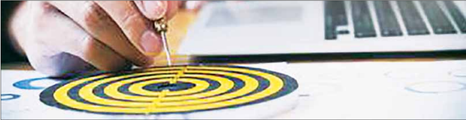
تصویر باکیفیتی استفاده کنید که به برند یا کسب‌وکار‌تان مرتبط هستند و مورد توجه مخاطبان هدف‌تان قرار خواهند گرفت.

احتمال جلب‌توجه مشتری‌ها را پایین خواهد آورد. سعی کنید تا حد امکان از تصاویر باکیفیتی استفاده کنید که به برند یا کسب‌وکار‌تان مرتبط هستند و مورد توجه مخاطبان هدف‌تان قرار خواهند گرفت. عکس‌های‌تان را برای استفاده در سایت بهینه‌سازی کنید: اگر تجربه چندانی در استفاده از عکس‌ها در سایت ندارید، این چند نکته مهم را برای شروع به خاطر داشته باشید: ابعاد عکس‌ها را به‌گونه‌ای انتخاب کنید که برای استفاده در سایت‌تان مناسب باشند؛ تا حدی که به کیفیت عکس‌ها لطمه‌ای وارد نشود. حجم آنها را کمتر کنید (برای پایین آوردن زمان بارگذاری سایت)، به‌هنگام قرار دادن عکس‌ها در سایت از کلمات کلیدی مرتبط با متن در آنها استفاده کنید.