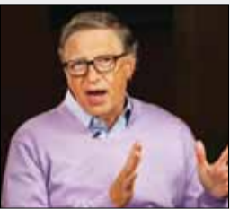
بیل گیتس زمان عرضه واکسن و ویروس کرونا را مشخص کرد