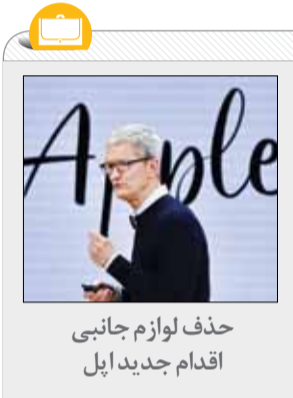
حذف لوازم جانبی اقدام جدید اپل

به گفته وی، «هم‌نشینی بین ویروس و وب باعث ایجاد تغییراتی شد که یکی دیگر از این تغییرات مهم، فراهم کردن زمینه‌های مستعد برای تغییرات فرهنگی از یادگیری و آموزش گرفته تا تولید و مصرف محصولات فرهنگی بوده است. گزارش‌ها در جهان بیانگر این است که مطالعه افراد در این مدت بالا رفته و اجبار به مطالعه و یادگیری نیز بیشتر شده است.»