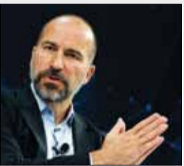
پیش‌بینی آینده اوبر توسط دارا خسروشاهی