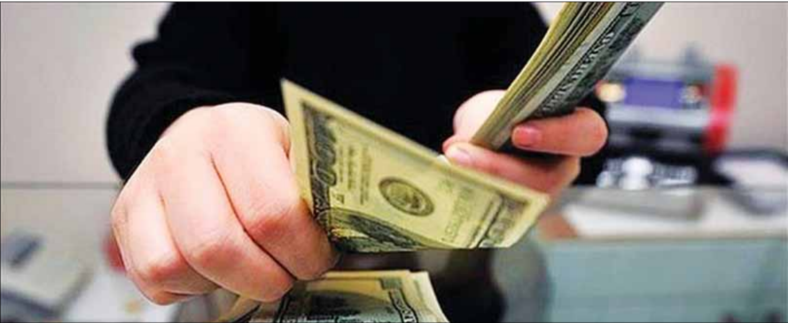
تصمیمی که عرضه ارز صادراتی را افزایش داد