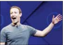
کاهش تعداد کاربران فیس‌بوک در آمریکا و کانادا