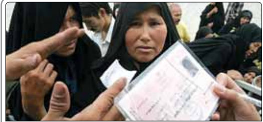
قوبدل مدیر اجرایی کانون هموفیلی ایران با اشاره به هزینه‌های بالای ارائه خدمات درمانی به بیماران هموفیلی افغان، بر لزوم رسمی شدن ارائه این خدمات تاکید کرد.