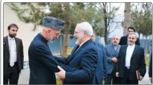
وزیر امور خارجه در جریان حضور در افغانستان با حنیف اتمر مشاور امنیت ملی افغانستان و حامد کرزای، رئیس‌جمهور سابق این کشور دیدار کرد