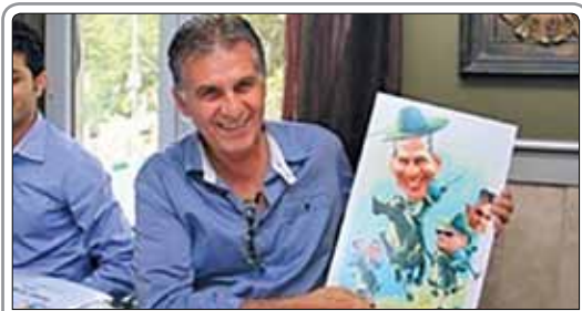
کارلوس کی‌روش در ۴۶ بازی با تیم ملی ایران، ۲۶ برد به‌دست آورده و در بازی مقابل قطر با کسب ۳۵ برد از رکورد ۲۴ برد تیم ملی با مابلی کهن عبور کرد و اکنون در بین مربیان تیم ملی پس از برانکو، صاحب بیشترین پیروزی است