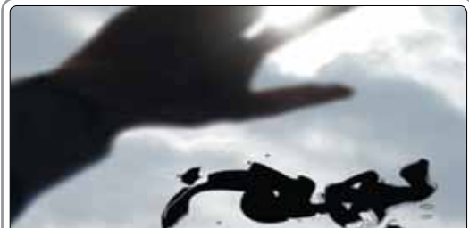
پوستر اصلی فیلم سینمایی «همین» ساخته مرتضی فرشپای در آستانه سی‌وسومین جشنواره فیلم فجر رونمایی شد