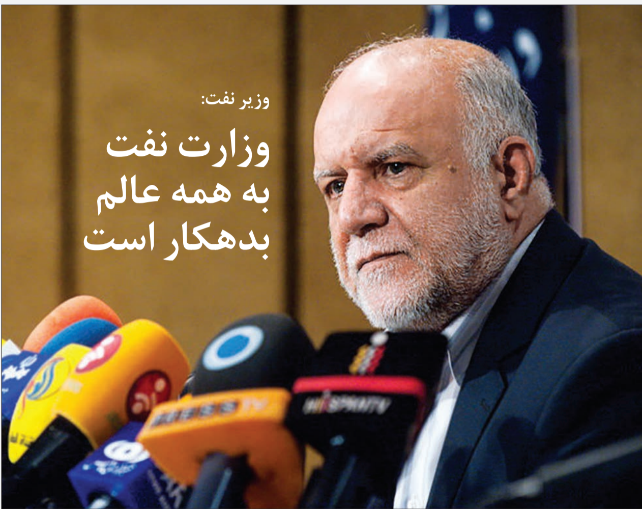
محمدرضا دستچردی | ایسنا

زنگنه درباره امضای تهاوت نفت ایران با کالای روسی با صراحت اعلام کرد: برای تهاوت کالا قراردادی امضا نکردیم. اما درباره موضوع دیگر که محرمانه است، امضا دادیم. وی در پاسخ به این پرسش که چرا وزارت نفت در صنایع بالادستی به بخش خصوصی بی‌اعتماد است اما به شرکت‌های خارجی اعتماد دارد و حمایت‌های آن از بخش‌های دیگر نیز کلامی است، گفت: صنعت نفت در مشارکت در تولید نفت نیز تنها در انحصار دولت باقی بماند. در حال حاضر، هم از حضور بخش خصوصی در صنعت نفت و گاز استقبال می‌کنیم؛ البته اگر حصولتی‌ها اجازه دهند. رقیب بخش خصوصی دولتی‌ها نیستند، بلکه خصولتی‌ها هستند، هر جا مناقصه‌ای گذاشته می‌شود خصولتی‌ها هم حضور دارند، هم پول دارند. بخش خصوصی واقعی ما بسیار نجیف و توان مالی آنها بسیار کم است.