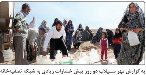
به گزارش مهر سیلاب دو روز پیش خسارات زیادی به شبکه تصفیه‌خانه آب الیگودرز وارد کرده است

معاون‌های رییس شورای شهر تهران توضیحاتی را درخصوص فعالیت همزمان رضازاده ارائه کرد. مهدی چمران صبح سه‌شنبه در حاشیه جلسه صد و چهل و چهارم شورای شهر تهران در جمع خبرنگاران درخصوص آخرین وضعیت حضور همزمان رضازاده در فدراسیون وزنه‌برداری و شورای شهر گفت: تا آنجا که بنده خبر دارم، حضور وی در انتخابات فدراسیون قطعی شده است. وی با بیان اینکه نامه‌ای اخیراً از سوی رضازاده به وزارت