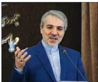
سخنگوی دولت همچنین

سخنگوی دولت ادامه داد: از فروردین ماه ۹۳ در سازمان مدیریت، آسیب‌شناسی برنامه ششم توسعه را شروع کردیم و حتی پیش‌نویسی از سیاست‌های کلی آن را هم تهیه کرده‌ایم. لذا در این بررسی‌ها به این نتیجه رسیدیم که داشتن برنامه ضروری است اما باید تحولی در برنامه‌نویسی ایجاد شود. نوبخت با اشاره به ویژگی‌های برنامه ششم، گفت: برنامه ششم با شکل و محتوای بهتر و مختصرتر