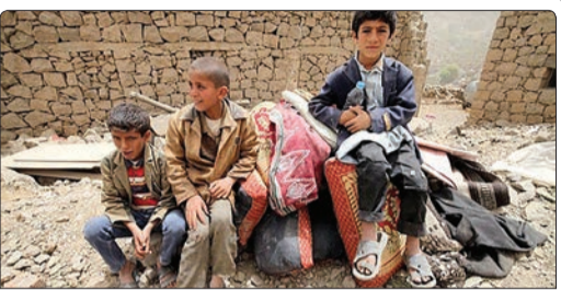
پرواز هواپیماهای شناسایی در صعد، آوارگی ۱۲۰ هزار یمنی از آغاز تجاوز عربستان به یمن و بمباران نیروگاه برق در البیضاء آخرین اخبار فاجعه حمله به یمن است

درحالی‌که نیروهای عراقی با کمک داوطلبان مردمی و جنگنده‌های ائتلاف پس از حمله‌ای غافلگیرانه به داعش در رمادی توانستند به پیشروی‌هایی در این شهر دست یابند، منابع عراقی از شدیدترین حمله داعش به پالایشگاه بیجی خبر دادند. منابع سیاسی یمن از طرح احزاب و شخصیت‌های سیاسی این کشور به منظور حل بحران موجود و مقدمه‌ساز برای آغاز مرحله انتقالی جدید در یمن خبر دادند.