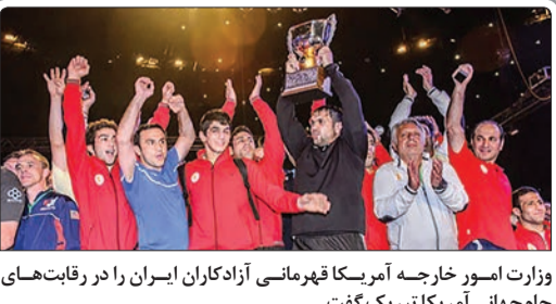
وزارت امور خارجه آمریکا قهرمانی آزادگان ایران را در رقابت‌های جام جهانی آمریکا تبریک گفت

سایت اسپورت ۳۶۰ در گزارشی به آینده نامشخص تیم ملی فوتبال ایران در صورت خروج کی‌روش پرداخت. فاطمه هاشمی با کسب تمام آرایس فدراسیون ورزش بیماران خاص و پیوند اعضا شد.