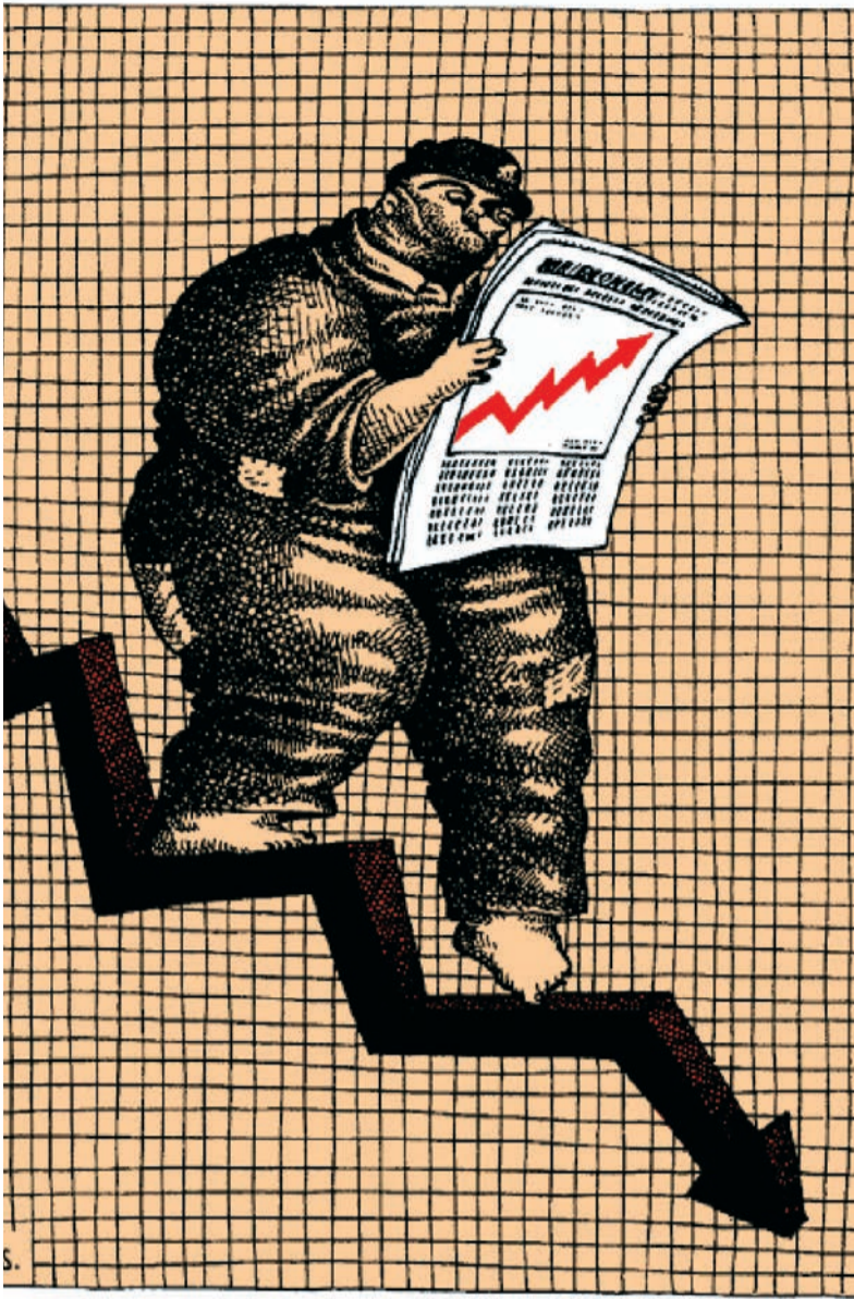
Ates - Cartoon Web

سوال مشخص است. دولت در هر سیاستی فقط به دنبال این