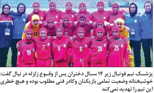
پزشک تیم فوتبال زیر ۱۴ سال دختران پس از وقوع زلزله در نیال گفت: خوشبختانه وضعیت تمامی بازیکنان و کادر فنی مطلوب بوده و هیچ خطری این تیم را تهدید نمی‌کند