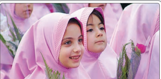
معاون آموزش ابتدایی وزارت آموزش و پرورش گفت: ثبت‌نام دانش آموزان در مقطع ابتدایی از اول خرداد ماه آغاز می‌شود