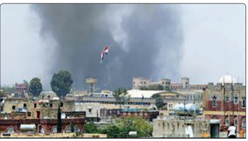
به نقل از شبکه المیادین، جنگنده‌های سعودی حملات خود را به استان‌های بتمی به‌ویژه در عدن شدیدتر کرده و همچنین تعز، مارب و شهر زبید در الحدیده در غرب یمن را هدف قرار دادند از سوی دیگر نیز مقامات آمریکایی اعلام کرده‌اند که واشنگتن هواپیمای ناو جنگی خود را از نزدیکی سواحل یمن خارج کرده است

استفان دی‌میستورا فرستاده ویژه سازمان ملل به سوریه در گزارشی به شورای امنیت از برنامه خود برای آغاز گفت‌وگوهای جدید با طرف‌های درگیر در سوریه و قدرت‌های تأثیرگذار بر بحران این کشور در اوایل ماه مه خبر داد. شبکه الجزیره مدعی شد که جنگنده‌های رژیم صهیونیستی جمعه شب برخی مواضع نظامی سوریه و حزب الله لبنان را در اطراف دمشق بمباران کرده‌اند.