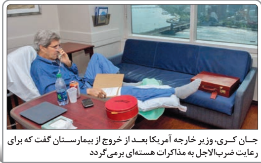
جان کری، وزیر خارجه آمریکا بعد از خروج از بیمارستان گفت که برای رعایت ضرب‌الاجل به مذاکرات هسته‌ای برمی‌گردد