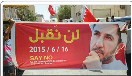
با نزدیک شدن به زمان برگزاری جلسه قرائت حکم دبیر کل جمعیت الوفاق بحرین، هزاران نفر از مردم این کشور با برگزاری تظاهراتی خواهان آزادی فوری وی شدند

◀ نیروهای کرد سوری در ادامه پیشروی‌های خود به سمت شهر و گذرگاه استراتژیک تل‌ابیش در شمال این کشور، کنترل کامل شهرک سلوک در حومه استان رقه را در دست گرفتند و داعش را در آستانه بزرگ‌ترین شکست خود در سوریه قرار دادند. ◀ دیوان عالی آفریقای جنوبی ضمن موافقت با درخواست دیوان بین‌المللی کیفری با صدور حکمی مانع خروج عمرالبشیر از این کشور شد.