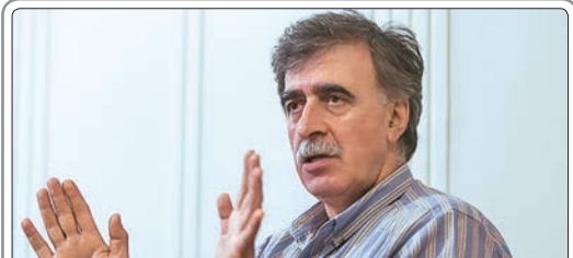
همایون اسعدیان سخنگوی کانون کارگردانان سینمای ایران اعلام کرد مراسم ششمین «شب کانون کارگردانان سینمای ایران» ۱۰ تیر ماه در پردیس سینمایی ملت برگزار خواهد شد

به گزارش لیبرتی، فیلم «کارآموز» که قرار است ۲۵ سپتامبر راهی سینماها شود، دو بازیگر برنده اسکار را با هم به سینماها بازمی‌گرداند. با نمایش عکس‌ها و تریلر فیلم به نظر می‌رسد آن هاتاوی و رابرت دنیرو به خوبی با هم همراه شده‌اند. فیلمنامه این فیلم را نانسی مه‌ریز نوشته که «پسچیده است» را در کارنامه دارد. منتقدان از این فیلم به‌عنوان فیلمی گرم و صمیمانه یاد کرده‌اند. این در حالی است که ابتدا قرار بود رئیس ویترسپون نقش اصلی زن فیلم را بازی کند.