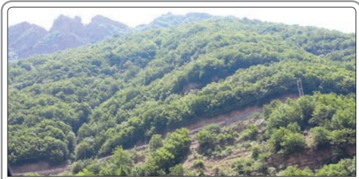
نمایندگان مجلس با یک فوریت طرح حفاظت و صیانت از جنگل‌ها مخالفت کردند و بر این اساس این طرح به‌صورت عادی در دستور کار مجلس قرار می‌گیرد

از کل مراجعین به دلیل صدمات ناشی از نزاع در دو ماه نخست امسال ۱۶ هزار و ۴۲۹ نفر مرد و ۷۶۳ نفر زن بوده‌اند. در اردیبهشت امسال نیز مراجعین نزاع به مراکز پزشکی قانونی استان تهران با ۱۰۰ درصد کاهش نسبت به اردیبهشت سال قبل ۹ هزار و ۹۸۹ نفر اعلام شده است.