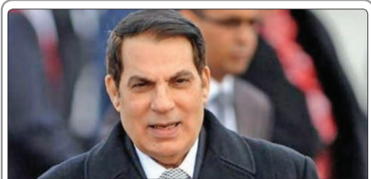
سخنگوی دادگاه بدوی تونس اعلام کرد: حکم زندان زین العابدین بن علی رییس‌جمهوری سابق تونس به مدت ۱۰ سال و جریمه مالی وی به میزان ۱۱۵ هزار دلار صادر شد

خبرنگاران خبرگزاری رسمی ایتالیا (آنسا) علیه برنامه تعدیل نیرو در سال جاری میلادی، دست به اعتصاب زدند. آسوشیتدپرس گزارش داد یک سند محرمانه نشان می‌دهد که اگر تهران برنامه هسته‌ای خود را محدود کند، آمریکا و شرکای مذاکره‌ای آن آماده ارائه پیشنهادهای با فناوری پیشرفته و دیگر تجهیزات به ایران هستند.