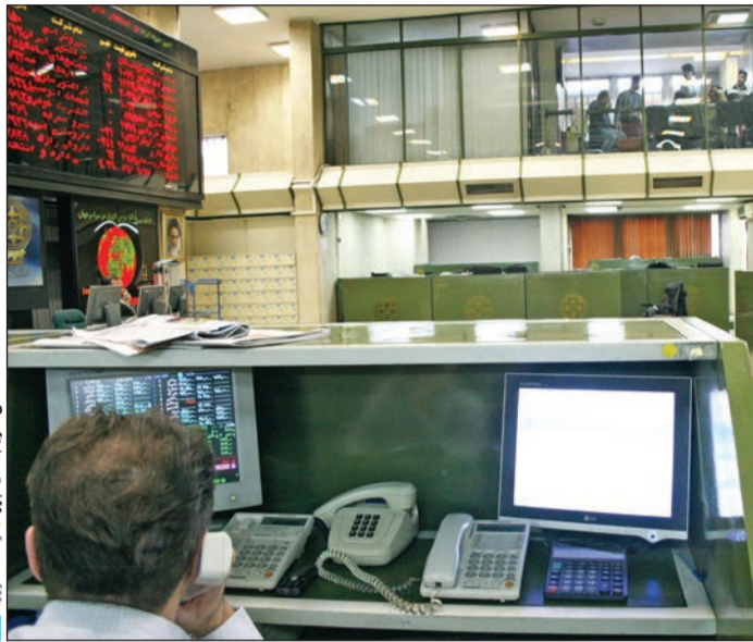
نویسنده: سید محمد صدرالغروی