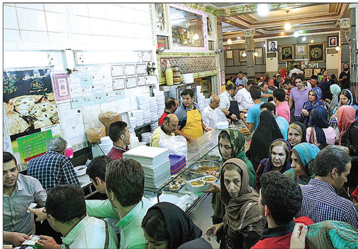
فروشگاه‌های حلیم با صف‌های طولانی از دیدنی‌های ماه رمضان به شمار می‌رود.