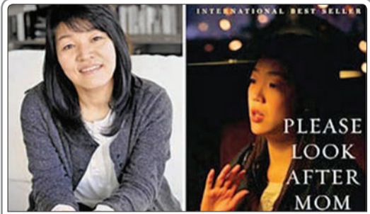
«شین کیونگ - سوک» نویسنده برنده جایزه ۳۰ هزار دلاری بوکر آسیایی به سرقت ادبی اعتراف و رسماً عذرخواهی کرد.

براساس نظرسنجی مجله ایمپایر شخصیت فیلم ایتالیایی جونیور در صدر برترین شخصیت‌های تاریخ فیلم و جیمز باند در رده دوم این فهرست قرار گرفت. مؤسسه حراجی کریستی در لندن با آثاری از هنر امپرسیونیست و مدرن در یک روز به فروش ۱۱۲ میلیون دلاری رسید. نادر مشایخی آهنگساز و رهبر ارکستر گفت: در سال‌هایی که در آلمان زندگی کردم، چیزی به‌عنوان «لغو کنسرت» ندیدم، مگر اینکه اتفاقی برای هنرمند افتاده باشد.