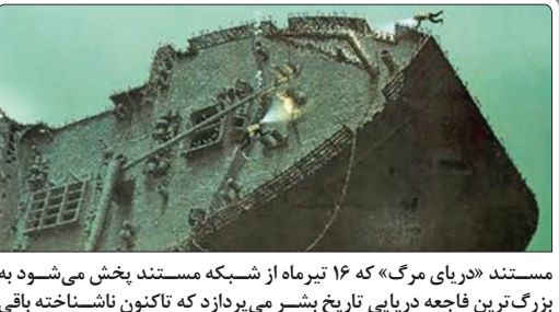
مستند «دریای مرگ» که ۱۶ تیرماه از شبکه مستند یخش می‌شود به بزرگ‌ترین فاجعه دریایی تاریخ بشری می‌پردازد که تاکنون ناشناخته باقی مانده است