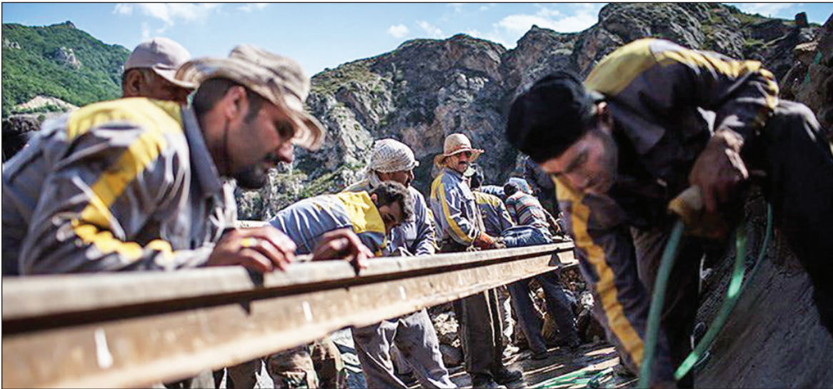
نگاهی به وضعیت حمل‌ونقل ریلی در روزهای پساتحریم

نایب رییس کانون سراسری انبوه‌سازان کشور با اشاره به اینکه برای کل صنعت ساختمان باید یک تشکیک تشکیل شود، ادامه داد: باید صنفت، کل صنعت ساختمان را پوشش دهد تا از این نابسامانی جلوگیری شود، ضمن آنکه صدور خدمات فنی و مهندسی هم در قالب یک صنف رونق پیدا می‌کند.