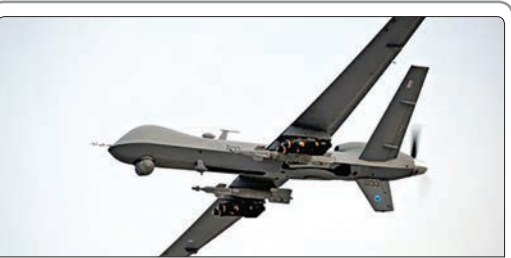
منابع ارشد اطلاعاتی انگلیس اعلام کردند نیروهای ویژه این کشور برای حمله به مناطق تحت کنترل داعش در عراق و سوریه چراغ سبز دریافت کرده‌اند

◀ دولت کویت بررسی اتهامات بیش از ۴۰ فرد مظنون به دست داشتن در انفجار انتحاری مسجد امام صادق (ع) این کشور را به دادستانی کل ارجاع داد.