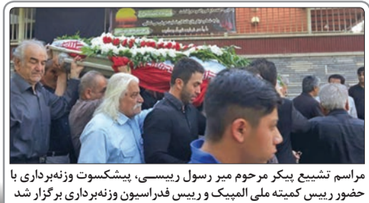
مراسم تشییع بیکر مرحوم میر رسول ریسی، پیشکسوت وزنه‌برداری با حضور رئیس کمیته ملی المپیک و رئیس فدراسیون وزنه‌برداری برگزار شد