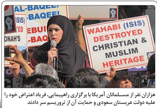
هزاران نفر از مسلمانان آمریکا با برگزاری راهپیمایی، فریاد اعتراض خود را علیه دولت عربستان سعودی و حمایت آن از تروریسم سر دادند