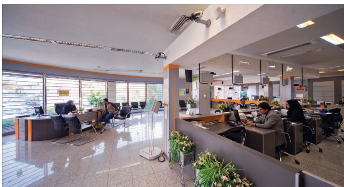
تبعات کاهش دستوری نرخ سود بانکی

نخستین بانک اسلامی موسوم به KT Bank AG در شهر فرانکفورت آلمان آغاز به کار کرد. به گزارش پوئی مالی به نقل از اسپوتنیک، کمی‌تی بانک شعبه نهاد مالی ترکی - کویتی موسوم به کویت تورک بانک Kuveyt Turk Bank است. راه‌اندازی این بانک برای شرکت‌های کوچک و متوسط و بخش مسکن مفید خواهد بود. فعالان این بخش‌ها می‌توانند نیازهای مالی خود را از طریق این بانک تأمین کنند. مسئولان این بانک در نظر دارند شعبات آن را در کلن، دوسلدورف نیز دایر کنند. این بانک حتی براساس معیارهای بانکداری اسلامی سود نمی‌گیرد و براساس اصول اخلاقی و مسئولیت‌پذیری اجتماعی و به دور از هرگونه سودجویی و سوداگری فعالیت خواهد کرد. در ترکیه بین ۷ تا ۸ درصد مؤسسات مالی چین و یوژگی و ماهیتی دارند. اما شمار آنها اکنون در کشورهای اسلامی و اروپا در حال افزایش است. براساس برخی برآوردها، دارایی بانک‌های اسلامی در جهان بین هزار تا ۲ هزار میلیارد دلار بالغ می‌شود.