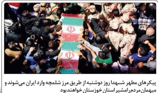
بیکرهای مطهر شهیدان روز دوشنبه از طریق مرز شلمچه وارد ایران می‌شوند و میهمان مردم رامشیر استان خوزستان خواهند بود