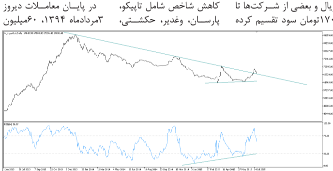
شاخص کل بورس در یک نگاه

همچنین نماد سیمان کردستان، ماسه ریخته‌گری و شرکت سخت‌آژند و پتروشیمی کرمانشاه مشمول بازگشایی نماد شده و شرکت‌هایی مانند سیمان هرمزگان دچار توقف شدند. دیروز نمادهای تأثیرگذار در کاهش شاخص شامل تایپکو، پارسان، وغدیر، حکشتی،