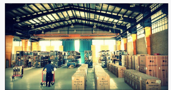
استراتژی‌های برندینگ دیجی کالا زیر ذره‌بین «فرصت امروز»