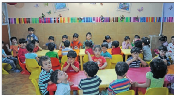
گزارش «فرصت امروز» از سرمايه گذاری در راه اندازی مهد کودک