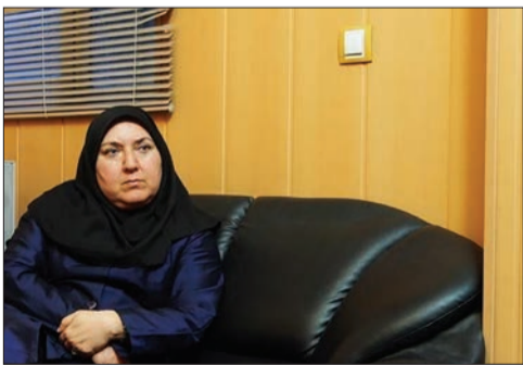
در اجلاس شورای حکام خط‌مشی‌های بودجه مورد نیاز تصویب می‌شود