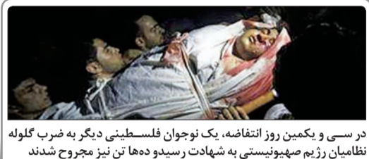
در سی و یکمین روز انتفاضه، یک نوجوان فلسطینی دیگر به ضرب گلوله نظامیان رژیم صهیونیستی به شهادت رسید و ده‌ها تن نیز مجروح شدند

مسکو و قاهره به صورت مشترک احتمال انجام سوءقصد تروریستی را در سقوط هواپیمای ایرپاس ۳۲۱ روسی بر فراز شبه‌جزیره سینا با ۲۲۴ قربانی را رد و اعلام کردند که تحقیقات در این زمینه ادامه خواهد یافت.