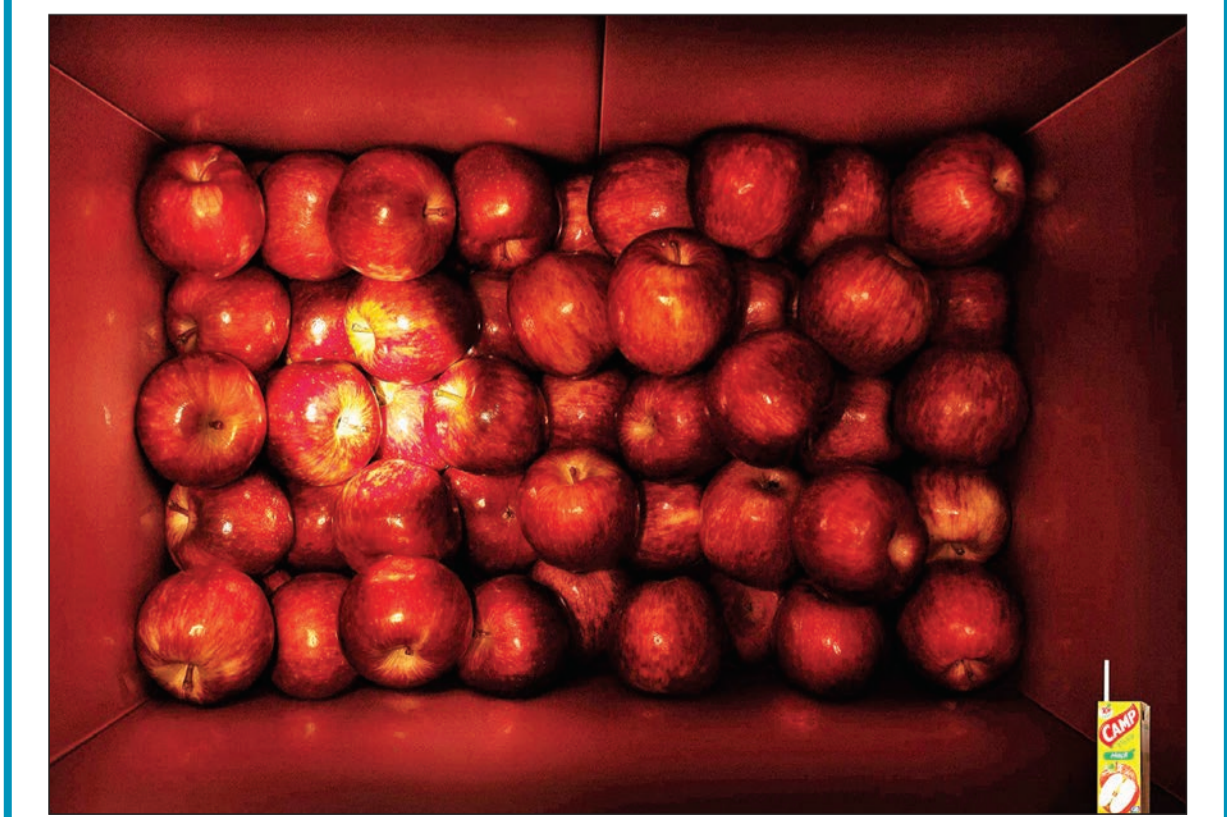
آگهی: آبمیوه Camp - آژانس تبلیغاتی: McGarryBowen, سانو پائولو، برزیل