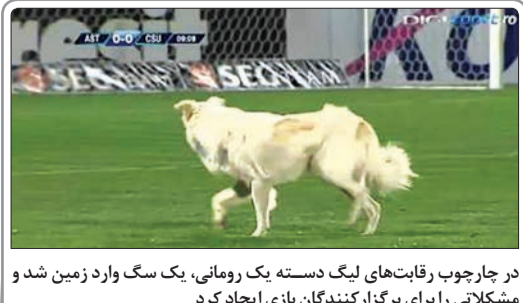
در چارچوب رقابت‌های لیگ دسته یک رومانی، یک سگ وارد زمین شد و مشکلاتی را برای برگزارکنندگان بازی ایجاد کرد

آرسن ونگر سرمربی آرسنال اعلام کرد از اینکه تیمش به رکورد ۲۰۰۰ گل در دوران مربیگری او رسیده خوشحال است اما تنها سه امتیاز است که اهمیت دارد.