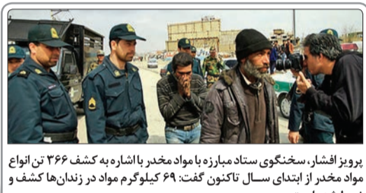
پرویز افشار، سخنگوی ستاد مبارزه با مواد مخدر با اشاره به کشف ۳۶۶ تن انواع مواد مخدر از ابتدای سال تاکنون گفت: ۶۹ کیلوگرم مواد در زندان‌ها کشف و ضبط شده است

ولی‌الله آذروش، مدیرعامل ستاد معاینه فنی خودروهای تهران اعلام کرد: ۸۰ درصد خودروهای تهران فاقد معاینه فنی است.