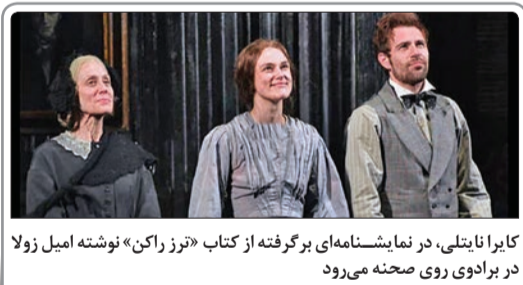
کایرا نایتلی، در نمایشنامه‌ای برگرفته از کتاب «ترز راکن» نوشته امیل زولا در برادوی روی صحنه می‌رود

کامریج در حمایت از مهاجران سوری سخن گفت.