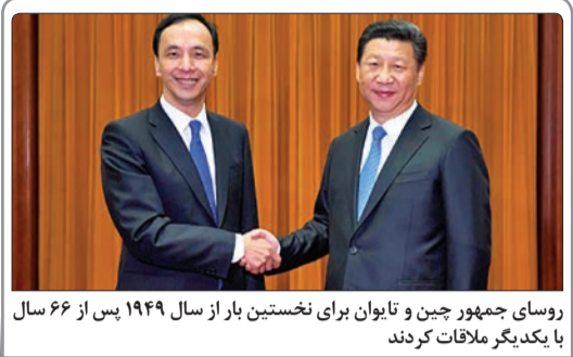
روسای جمهوری چین و تایوان برای نخستین بار از سال ۱۹۴۹ پس از ۶۶ سال با یکدیگر ملاقات کردند