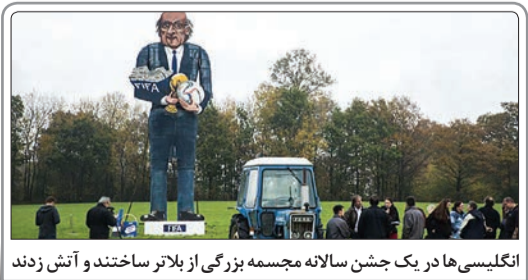
انگلیسی‌ها در یک جشن سالانه مجسمه بزرگی از بلاتر ساختند و آتش زدند