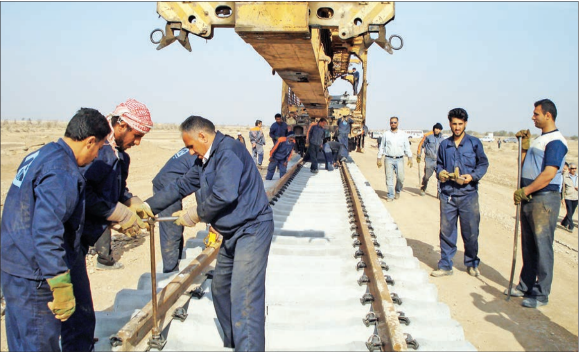
معاون آخوندی: منتظر تولید ریل ملی هستیم