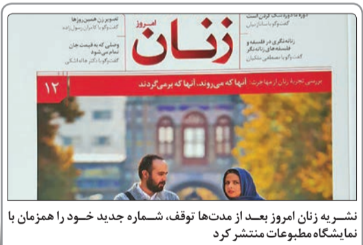
نشریه زنان امروز بعد از مدت‌ها توقف، شماره جدید خود را هم‌زمان با نمایشگاه مطبوعات منتشر کرد