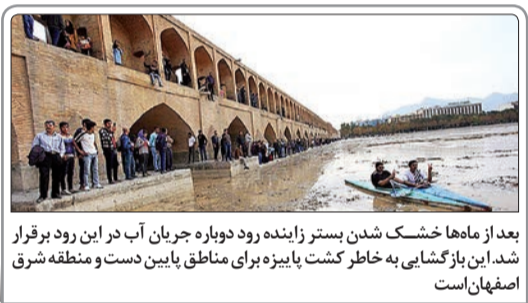
بعد از ماه‌ها خشک شدن بستر زاینده رود دوباره جریان آب در این رود برقرار شد. این بازگشایی به خاطر کشت پاییزه برای مناطق پایین دست و منطقه شرق اصفهان است