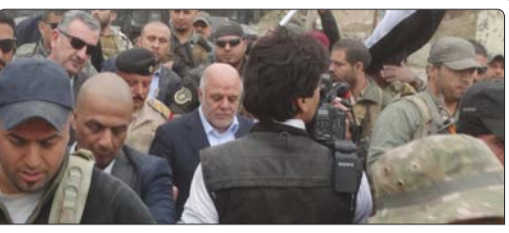
العبادی، نخست‌وزیر عراق در بازدید از شهر تازه آزاد شده رمادی تأکید کرد که نیروهای عراقی به‌زودی عملیات برای آزادی شهر موصل را نیز آغاز خواهند کرد