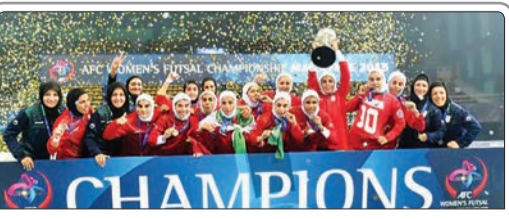
قهرمانی تیم ملی فوتسال زنان ایران در آسیا به گزارش سایت کنفدراسیون فوتبال آسیا (AFC) به عنوان یکی از مهم‌ترین اتفاقات سال ۲۰۱۵ انتخاب شد