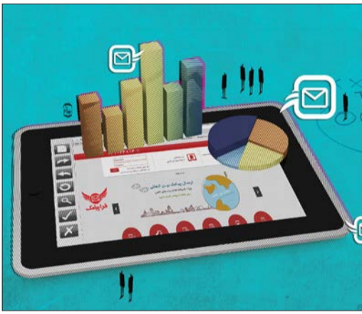
فرایماک، پتل ارسال پیامک