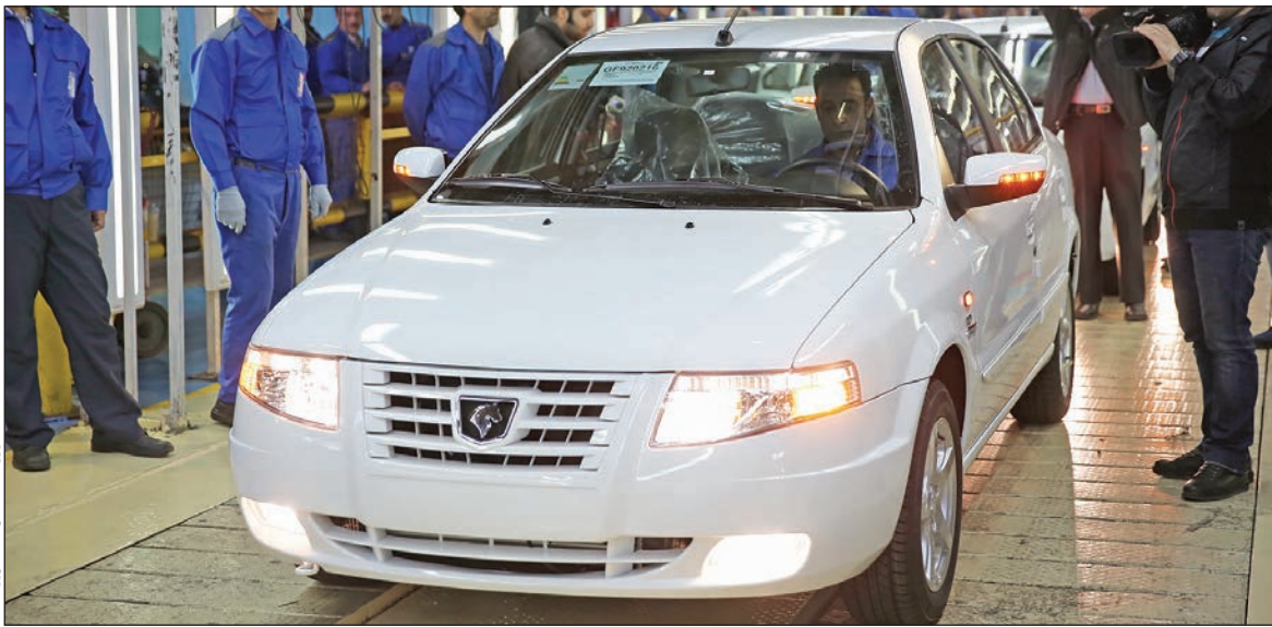
آرژونتات فرصت امروز

موتور توربوشارژ روی همه محصولات ایران خودرو سوار می‌شود.