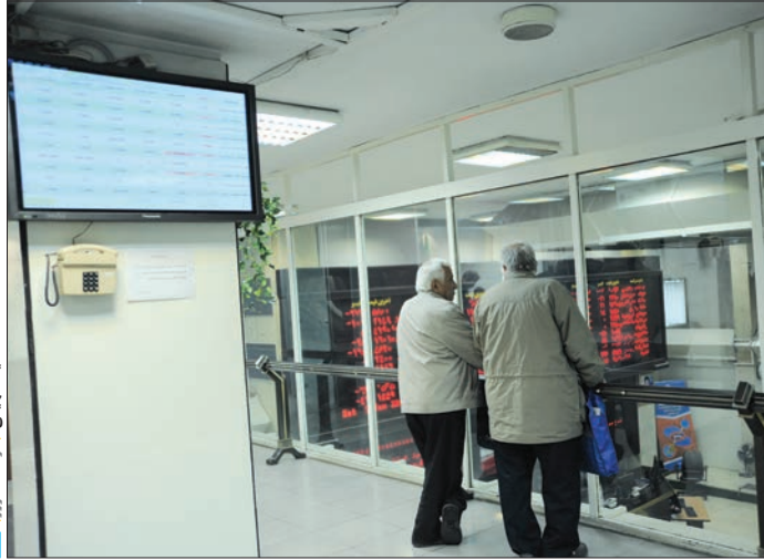
سهامی سبید سیمانی در وقت امروز

سیدمحمدصدرالغروی सदرولفارابی@yahoo.com شاخص کل بورس اوراق بهادار در پایان معاملات روز شنبه بازار سهام با ۴۱۹ واحد رشد در ارتفاع ۷۴ هزار و ۱۰۳ واحد ایستاد. بازار سهام در حالی همچنان شاهد تقویت حجم و ارزش معاملات روزانه بود که بعد از گذراندن یک هفته رویایی با کسب بازدهی ۱۸ درصدی، به مسیر رو به رشد خود ادامه داد و موفق به عبور از کانال ۷۴ هزار واحدی شد. در بازار دیروز مجدداً ارزش و حجم معاملات بالا رفت و نقدینگی جدید وارد این بازار شد به طوری که در معاملات بیش از ۱۷۰ میلیون سهم به ارزش ۳۷۴ میلیارد تومان دادوستد شد و ارزش بازار سهام به ۳۱۷ هزار میلیارد تومان رسید. آنچه در شرایط فعلی بازار سهام قطعی به نظر می‌رسد این است که به تدریج حجم نقدینگی جدید وارد بازار سهام می‌شود که بررسی ارزش معاملات روزانه بورس به خوبی مویب این مطلب است. از طرفی رشد ارزش و حجم معاملات بیاتر افق روشن بورس و پتانسیل‌های آن برای حرکت در مسیر رشد است. در عین حال معاملات نخستین روز هفته در حالی آغاز شد که انعقاد قراردادهای جدید با شرکت‌های خارجی و خوش‌بینی سهامداران از بهبود وضعیت صنایع بورسی را تداعی بخشد.