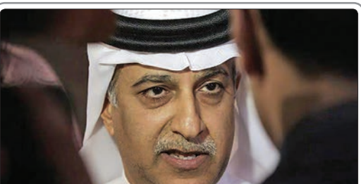
کنفدراسیون فوتبال آفریقا که بیشترین تعداد عضو را دارد، حمایت کامل خود از شیخ سلمان بحرینی در انتخابات ریاست فیفا را رسماً اعلام کرد

Evening Standard در این زمینه نوشت که خورخه مندس، مدیر برنامه های مورینیو با رئیس شرکت چینی Alisports که با باشگاه گوانگژو در ارتباط است، قراردادی امضا کرده که به موجب آن، مورینیو به این باشگاه چینی مشاوره می دهد و پیوستن جکسون مارتنیس هم زیر نظر این مربی بزرگ بوده است. براساس خبر این سایت، مورینیو نه تنها به باشگاه گوانگژو، بلکه به چند باشگاه سرشناس دیگر چین مشاوره می دهد و همین باعث شده است تا او بیکار نباشد و بعد از اخراج از چلسی در زمینه های دیگری فعالیت داشته باشد. لیگ چین در پنجره جابه جایی زمستانی فعالیت زیادی داشت و ستاره های زیادی راهی لیگ این کشور شدند و همین باعث شده تا به قوی ترین لیگ قاره آسیا تبدیل شود.