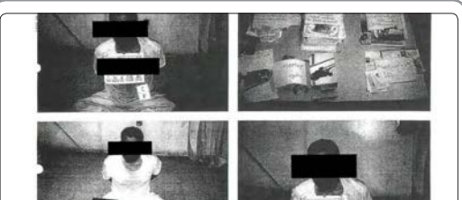
وزارت دفاع آمریکا بعد از یک دهه مجادله حقوقی بر سر مجرمانه نگه داشتن تصاویر شکنجه زندانیان در جریان جنگ های عراق و افغانستان، سرانجام مجبور به منتشر کردن ۱۹۸ تصویر از این زندانیان شد

کسینجر، وزیر خارجه اسبق و سیاستمدار کهنه کار آمریکا پس از دیدار با پوتین تصریح کرد که روابط میان واشنگتن و مسکو در زمان کنونی تقریباً در بدترین وضعیت خود قرار دارد. مدیران اجرایی رسانه های جهان از دولت ها خواستند تا نگاه به خبرنگاران به عنوان دشمنان را متوقف کرده و از خبرنگارانی که جنگ ها، جنایات و فسادها را پوشش می دهند، بهتر حفاظت کنند.