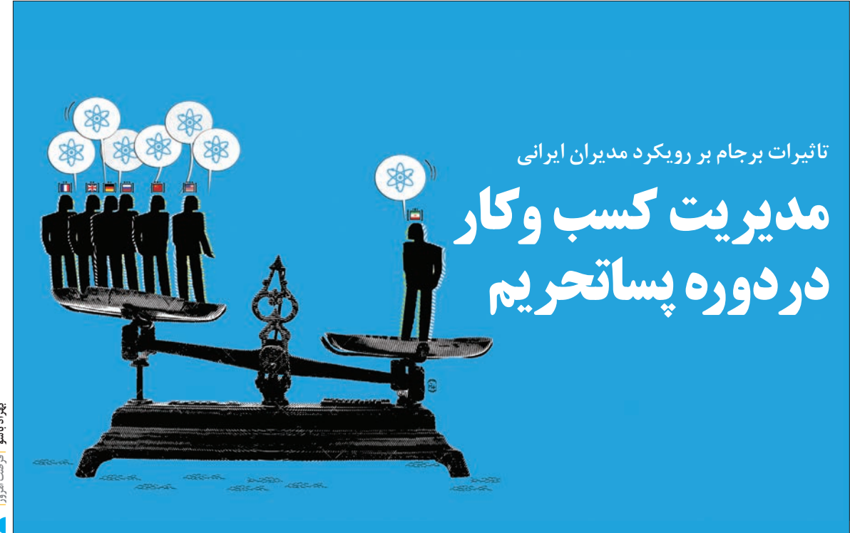
بهروز باهنر - فرصت امروز