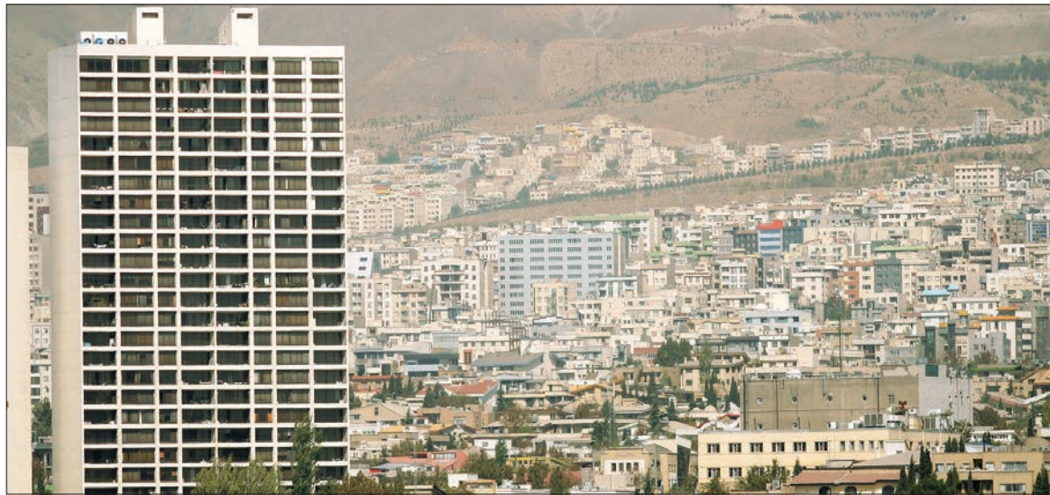
وام ۸۰ میلیونی اجرایی شد

وی با تاکید بر پرهیز از تمرکزگرایی ریلی در تهران افزود: ایجاد ایستگاه جدید با این هدف مورد تأیید است و شورای عالی معماری و شهرسازی این آمادگی را دارد تا توجه به اسناد بالادستی ساخت ایستگاه‌های چندوجهی (TOD) و ایستگاه‌های جدید را در تهران و سایر شهرها مورد بررسی قرار دهد.