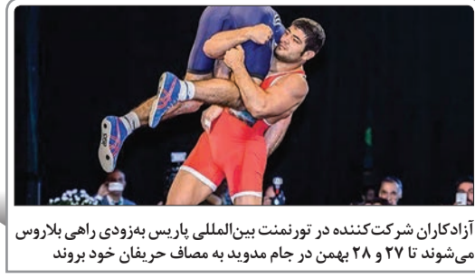
آزادکاران شرکت‌کننده در تورنمنت بین‌المللی پاریس به زودی راهی بلاروس می‌شوند تا ۲۷ و ۲۸ بهمن در جام مدوید به مصاف حرفه‌ای خود بروند

علی کفاشیان، رئیس فدراسیون فوتبال در پاسخ به این پرسش خبرنگار مهر که به نظر می‌رسد اتفاقات اخیر و اتهاماتی که به شما وارد می‌شود برای کنار گذاشتن محترمانه از فدراسیون است، گفت: اگر بنده را محترمانه کنار بگذارند افتخار می‌کنم. من هشت سال با افتخار به‌عنوان رئیس فدراسیون کار کرده‌ام و قطعاً هر کسی هم که بیاید و بخواهد ریاست را بپذیرد به او کمک خواهیم کرد. او در مورد موضوع فوتبال ایران در مقابل ادعای عربستانی‌ها نیز گفت: ما پیگیر این موضوع هستیم و نام‌نگاری‌هایی هم انجام داده‌ایم اما نمی‌توانیم به فیفا شکایت کنیم چراکه آیین‌نامه فیفا با فدراسیون آسیا متفاوت است. رئیس فدراسیون فوتبال ادامه داد: ما در این باره نام‌های را به اعضای کنفدراسیون فوتبال آسیا فرستادیم که این تصمیم‌ها خلاف ماده ۳ و ۴ است. از طرفی غرب آسیا فقط پنج کشور است و برای آن‌طرف معنی پیدا نمی‌کند. کفاشیان همچنین یادآور شد: الان که این ماجرا