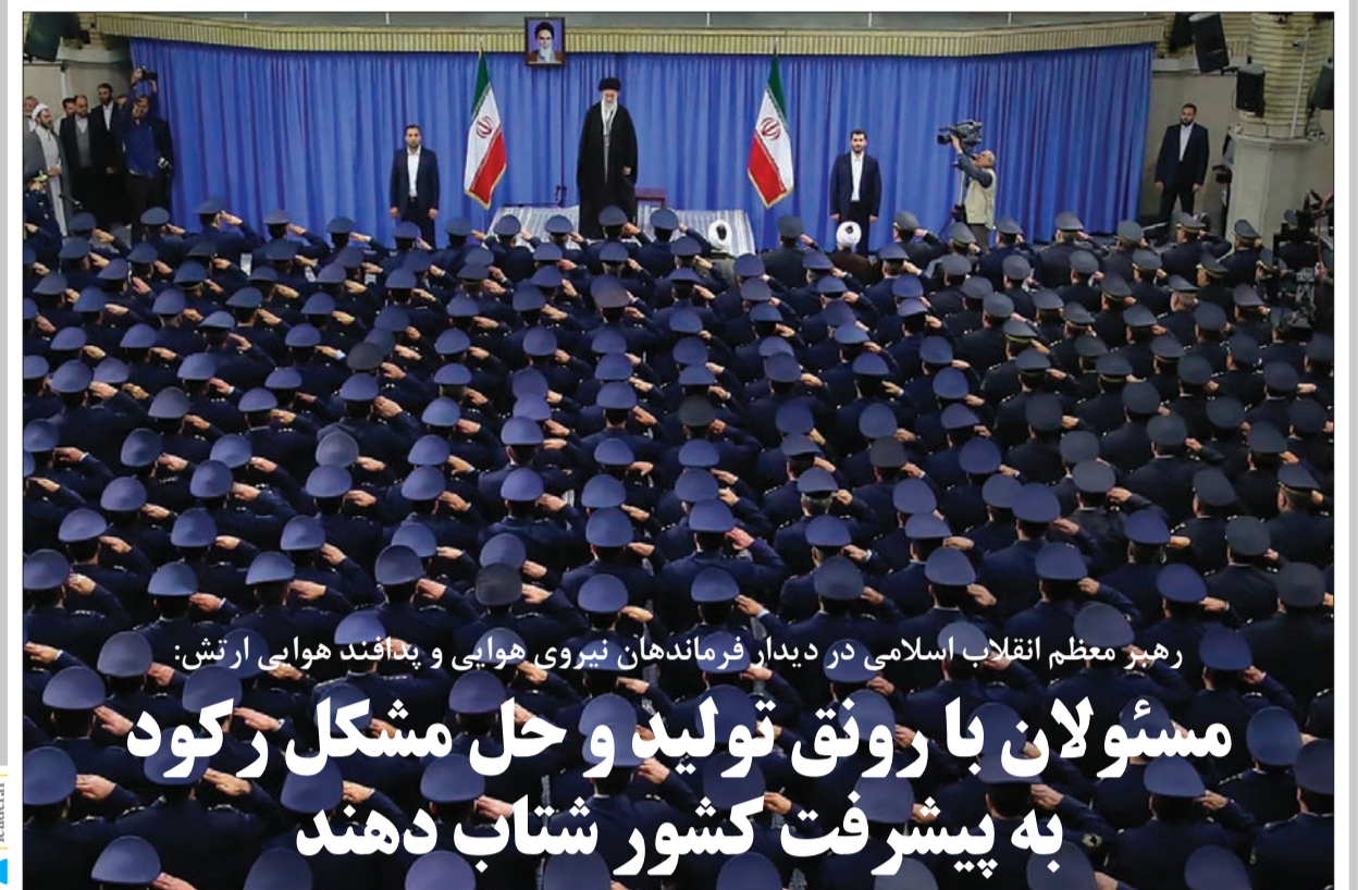
رهبر معظم انقلاب اسلامی در دیدار فرماندهان نیروی هوایی و پدافند هوایی ارتش: