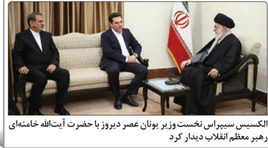
الکسیس سیراس نخست وزیر یونان عصر دیروز با حضرت آیت‌الله خامنه‌ای رهبر معظم انقلاب دیدار کرد

رهبر کاتولیک‌های جهان از جامعه بین‌الملل خواست که همه تلاش خود را برای دستیابی به راه‌حل سیاسی برای حل بحران سوریه به کار گیرد. پاپ فرانسیس، رهبر کاتولیک‌های جهان درباره وضعیت وخیم هزاران پناهنجوی سوری که از بیم خشونت‌ها، منازل خود را رها کرده و برخی از آنان نیز کشورشان را ترک کرده‌اند، ابراز نگرانی کرد و گفت: جامعه بین‌الملل باید ضمن همبستگی با پناهنجویان سوری، کمک‌های لازم را در اختیار آنان قرار دهد تا کرامت انسانی آوارگان حفظ شود. پاپ همچنین از جامعه بین‌الملل خواست که از هیچ تلاشی برای گردآوردن همه طرف‌ها بر سر میز مذاکره دریغ نکنند.