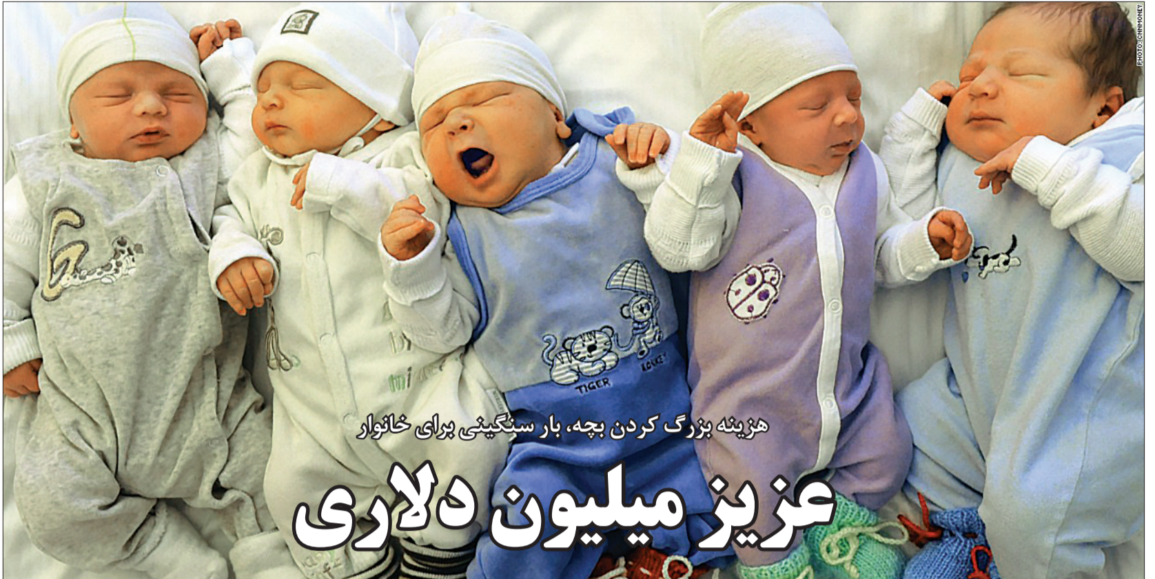
هزینه بزرگ کردن بچه، بار سنگینی برای خانوار

پدر و مادری که فرزند در راه دارند، می‌توانند از همان زمان بارداری به فکر بچه باشند. یکی از راهکارها افتتاح حسابی مختص کودک است که به کنترل خرج‌های کمک می‌کند. چون فرزند داشتن مسئولیت بزرگی است و تغییر زیادی در زندگی زن و مرد ایجاد می‌کند، پدر و مادر باید آینده‌نگر باشند. وقتی در زمان بارداری پولی برای بچه کنار گذاشته شود، این پول‌ها به داد پدر و مادر می‌رسد.