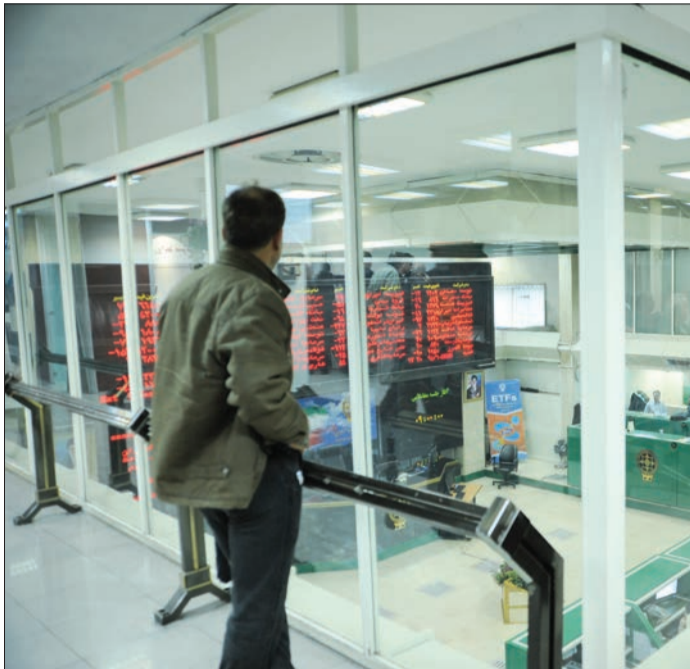
کتابخانه سهامی بورسی