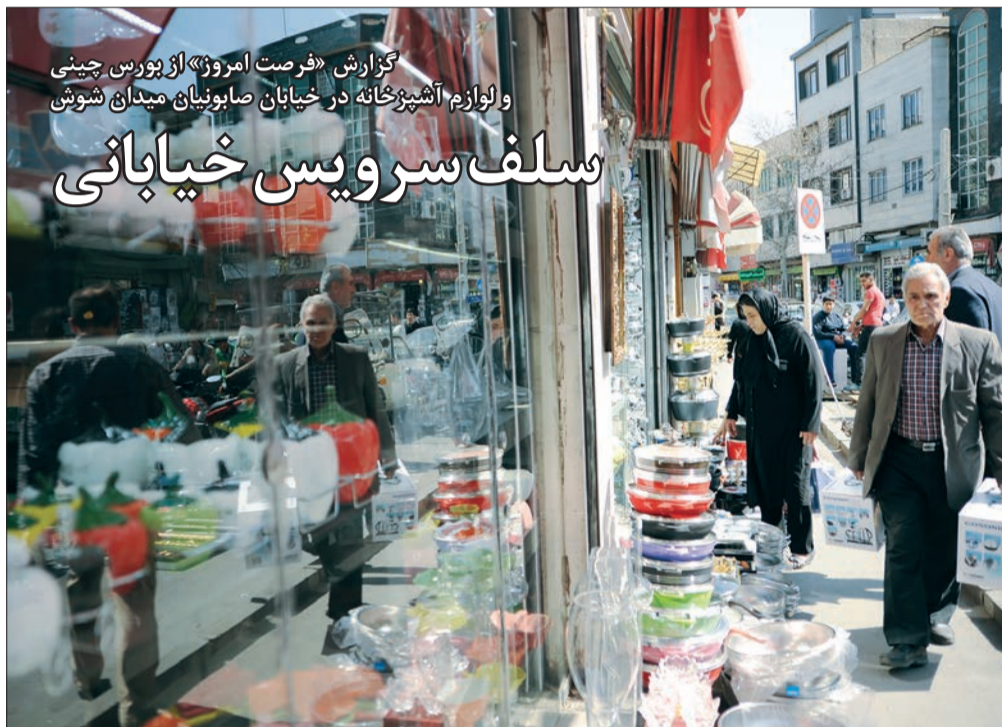
گزارش «فرصت امروز» از بورس چین و لوازم آشپزخانه در خیابان صابونپای میدان شوش