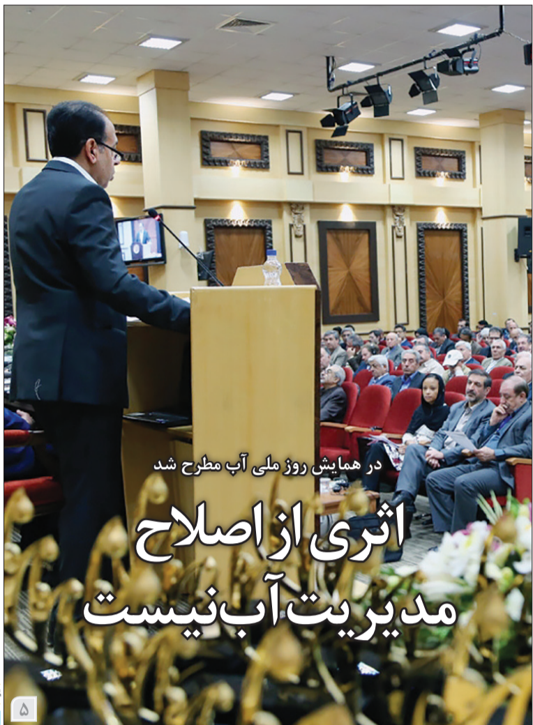
در همایش روز ملی آب مطرح شد