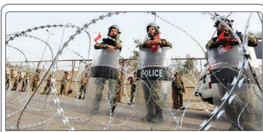
به‌دنبال فراخوان رهبان جریان صدر عراق برای تظاهرات علیه فساد، مقامات امنیتی عراق راه‌های منتهی به منطقه الخضراء را بستند