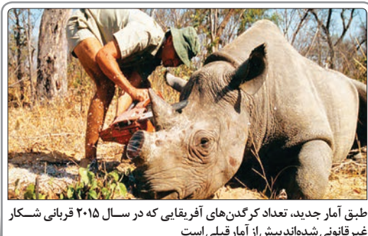
طبق آمار جدید، تعداد کرگدن‌های آفریقای که در سال ۲۰۱۵ قربانی شکار غیرقانونی شده‌اند بیش از آمار قبلی است