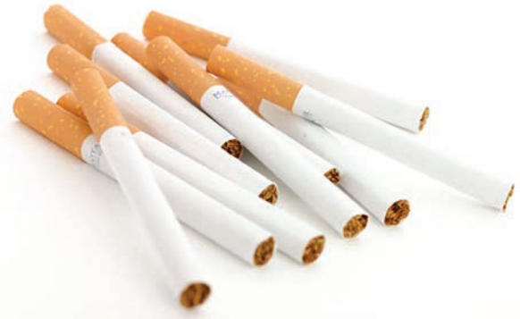
مدیرعامل شرکت دخانیات: