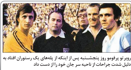
روبرتو پروفومو روز پنجشنبه پس از اینکه از پله‌های یک رستوران افتاد به دلیل شدت جراحات از ناحیه سر جان خود را از دست داد