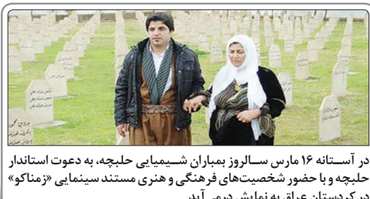
در آستانه ۱۶ مارس سالروز بمباران شیمیایی حلبچه، به دعوت استاندار حلبچه و با حضور شخصیت‌های فرهنگی و هنری مستند سیمنا «زمناکو» در کردستان عراق به نمایش درمی‌آید