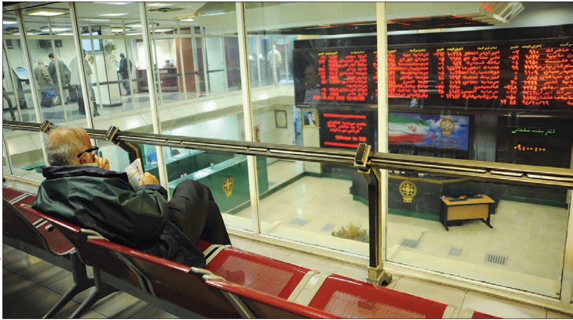
نمایی از بورس تهران

به‌طوری‌که دماسنج بازار سهام در هفته گذشته از کانال ۷۷ هزار و ۶۹۷ واحدی به ۷۸ هزار و ۳۱۲ واحد رسید و بازدهی خود را در سطح ۲۵ درصد نگه داشت. به این ترتیب روند حرکتی بورس در هفته گذشته و همچنین تلاش سهامداران برای خرید سهم موجب شد تا ارزش و حجم معاملات روند افزایشی داشته باشد و ورود نقدینگی جدید به این بازار را به نمایش بگذارد، به‌طوری‌که در هفته گذشته ارزش و حجم معاملات رشد کرد و به ترتیب ۱۰ هزار و ۶۵۸ میلیون سهم به ارزش ۲۵ هزار و ۶۷۲ میلیارد ریال دادوستد شد. همچنین در هفته گذشته دفعات معاملات با رشد ۱۵ درصدی مواجه شد و به بیش از ۶۱۱ هزار دفعه رسید و تعداد خریداران هم افزایش ۱۱ درصدی را تجربه کرد و به بیش از ۱۷۸ هزار نفر بالغ شد.