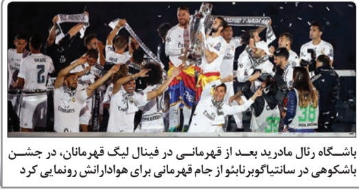
باشگاه رئال مادرید بعد از قهرمانی در فینال لیگ قهرمانان، در جشن باشکوهی در سانتیاگو برنابئو از جام قهرمانی برای هوادارانش رونمایی کرد

دیدینه دشان، سرمربی تیم ملی فرانسه به تمجید از زین‌الدین زیدان و قهرمانی او در چمپیونزلیگ در فصل اول مربی‌گری‌اش پرداخت. امیر غفور بازی حساس تیم ملی والیبالی ایران با فرانسه را به خاطر مصدومیت از دست داد.