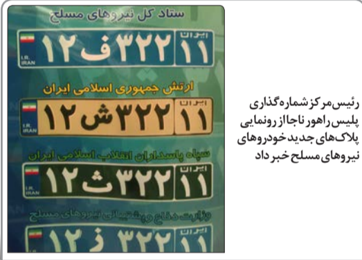
رئیس مرکز شماره‌گذاری پلیس راهور ناجا از رونمایی پلاک‌های جدید خودروهای نیروهای مسلح خبر داد

سردار حمید صدرالسادات، رئیس سازمان وظیفه عمومی نیروی انتظامی گفت: برای دریافت تسهیلات بانکی جریمه غیبت سربازی به بانک‌های عامل معرفی‌نامه می‌دهیم و متقاضیان تا پایان سال مهلت پرداخت جریمه غیبت را دارند. سیدمحمد بطحایی، معاون توسعه مدیریّت و پشتیبانی وزارت آموزش و پرورش گفت: هیات امنایی کردن وزارت آموزش و پرورش یک گام مثبت برای مشارکت سایر نهادهای است.