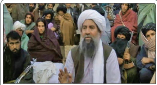
گروه انشعابی طالبان به رهبری «ملارسل» به شرط خروج نیروهای ناتو از افغانستان حاضر به مذاکره با دولت افغانستان شد

روسیه برنامه خرید محموله‌های آب سنگین تولید شده ایران را در دستور کار خود قرار داده و اعلام کرده که به احتمال قوی شرکت روس اتم این معامله را با طرف ایرانی انجام خواهد داد رئیس جمهوری ترکیه در اظهاراتی از حضور روسیه، آمریکا و ایران در سوریه انتقاد کرد و مدعی شد که عدم تمایل این سه کشور برای برکناری بشار اسد به ادامه رنج و درد این کشور کمک می‌کند.