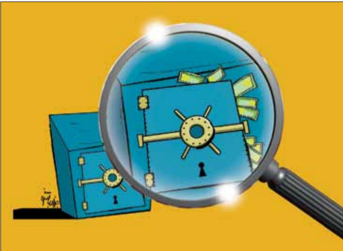
تولیدکنندگان خرد صورت

پیش‌تر حسن روحانی، رئیس‌جمهور در همایش روز صنعت، از بانک‌های کشور به دلیل بنگاه‌داری انتقاد کرد. علی طیب‌نیا، وزیر امور اقتصاد و دارایی نیز ضمن مخالفت با بنگاه‌داری بانک‌ها اظهار کرد: دولت معتقد است، وظیفه بانک‌ها جمع‌آوری سپرده مردم و ارائه تسهیلات به آنها است. در شرایطی که بانک‌ها مطالبات فراوانی دارند در برخی موارد مجبور می‌شوند اموال وثیقه‌ای را تملیک کنند که این املاک قابلیت عرضه و فروش ندارد. وی معتقد است، بخشی از شرکت‌ها و اموالی که در اختیار بانک‌ها قرار دارد، از طرف دولت به بانک‌ها داده شده است که خود بانک‌ها از این موضوع